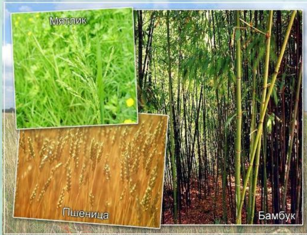
Растения семейства злаковых.

Помимо семейства лилейных, мы рассмотрим особенности растений семейства злаковых . Это одно из самых крупных семейств среди цветковых растений. В его состав входит более 10 000 видов растений.