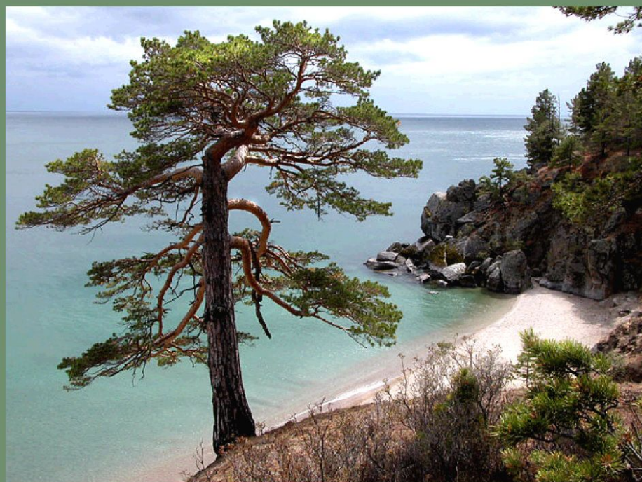
Сосна, растущая на побережье отличается внешне от сосны, растущей в лесу.