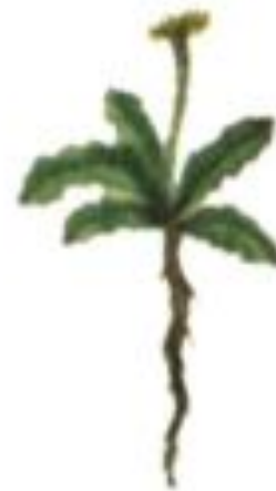
выращен в горах