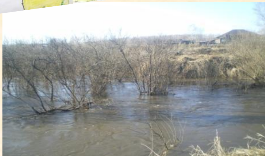
ПАВОДОК НА РЕКЕ БЕЛОЙ