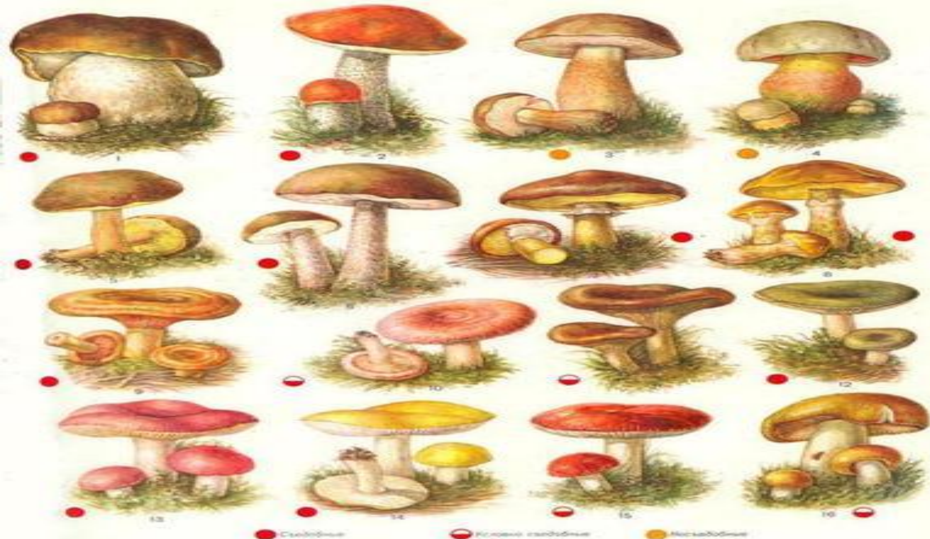
Ж. с. Г. Грибы. 1. Белый. 2. Подосиновик. 3. Желтый. 4. Сатаковский. 5. Мякоть яловая. 6. Подберезовик. 7. Масленок белый. 8. Масленок желтый. 9. Рыжик. 10. Волнушка. 11. Сыроежка. 12. Сыроежка желтая. 13. Сыроежка черная. 14. Сыроежка желтая. 15. Сыроежка красная. 16. Везувий.