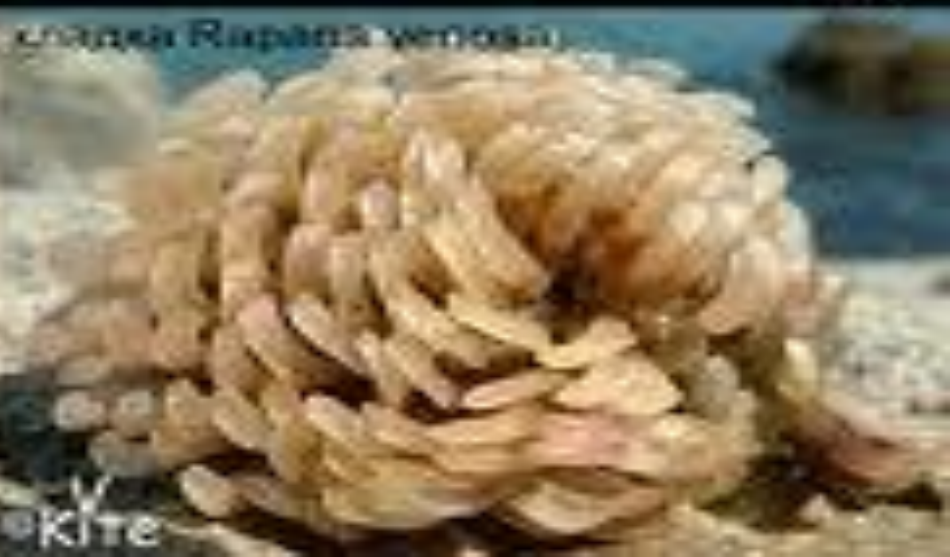
спадна Rapana venosa