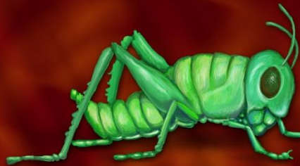
Ранняя стадия имаго