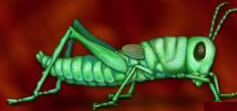
Поздняя стадия имаго