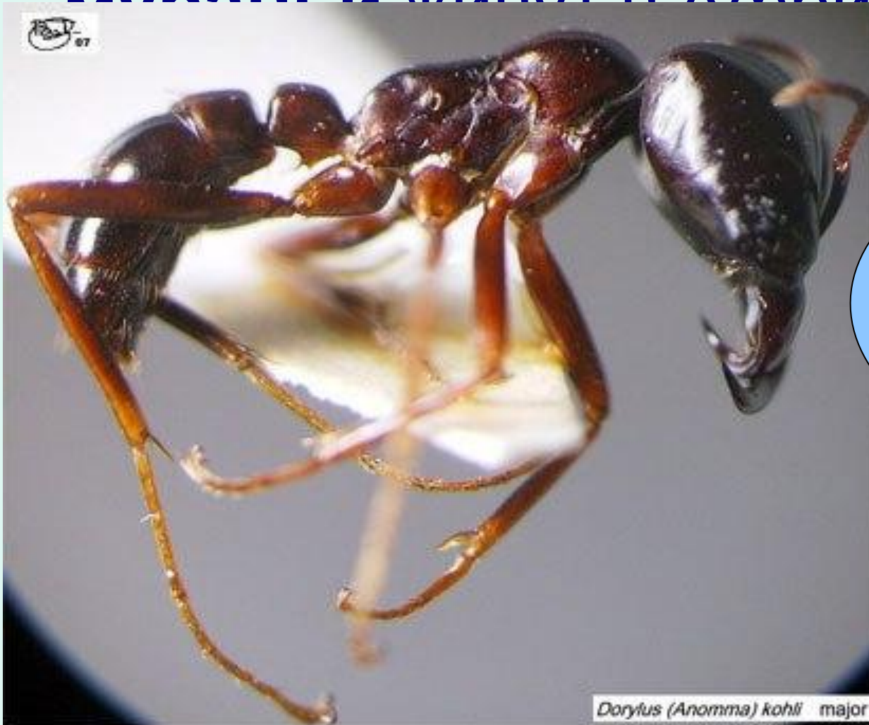
Dorylus (Anomma) kohli major