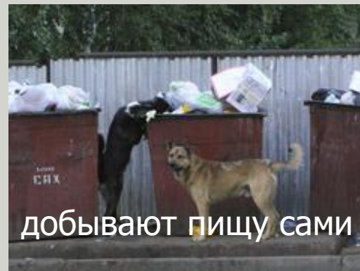
добывают пищу сами