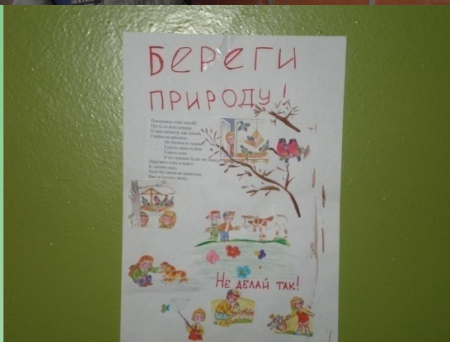
автор Сорокина Маша 4 «Б»