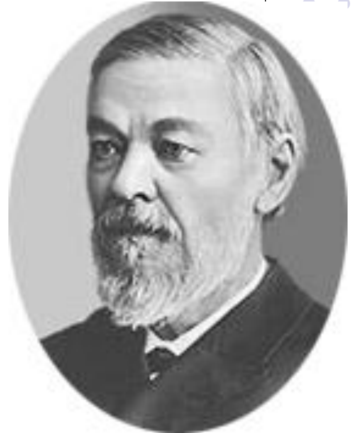
Сеченов И. М. 1829-1905 г.г.