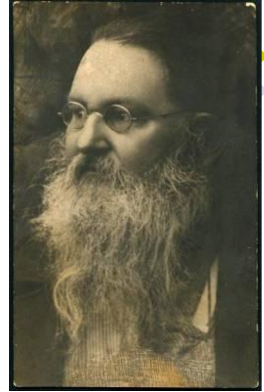
А.А. Ухтомский, физиолог

Пример: а) сосредоточение внимания, б) способность человека к волевым усилиям.