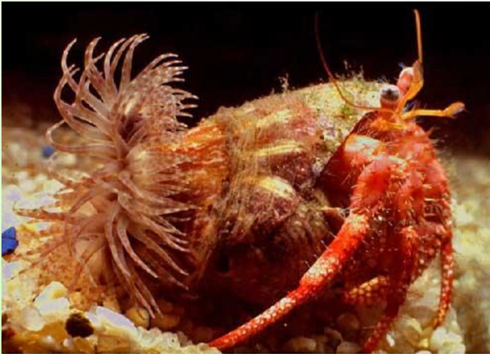
Анемона и рак-отшельник