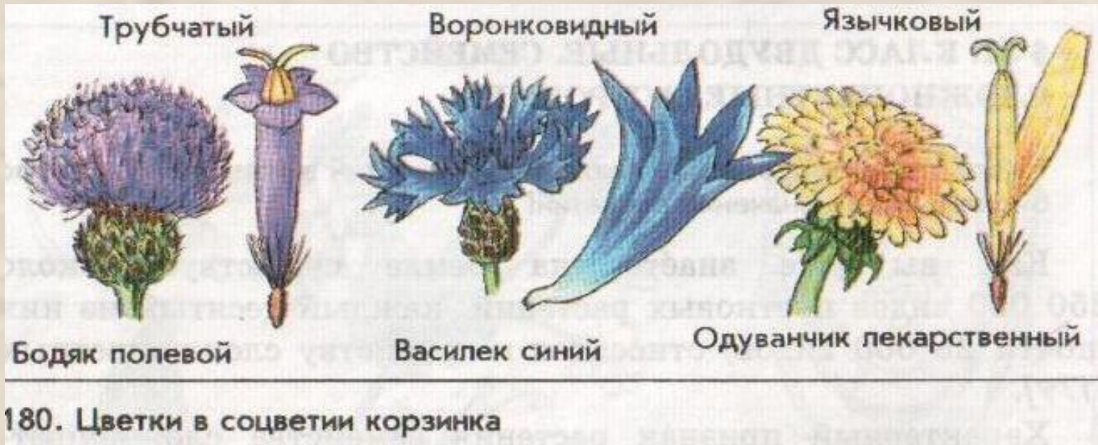
180. Цветки в соцветии корзинка

Цветки – язычковые (одуванчик), трубчатые (бодяк), воронковидные (василек)