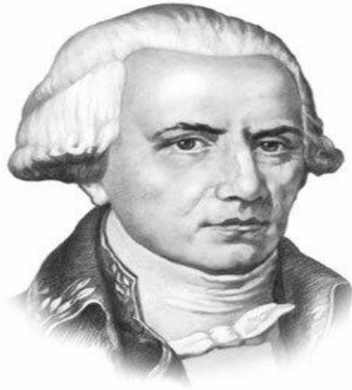
ЛАМАРК Жан Батист Пьер Антуан де Моне 1744-1829