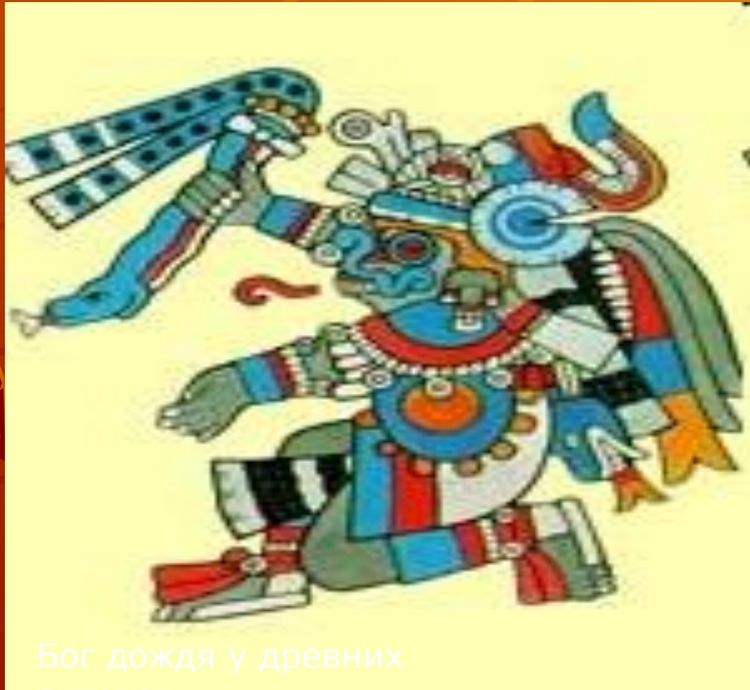
Бог дождя у древних ацтеков