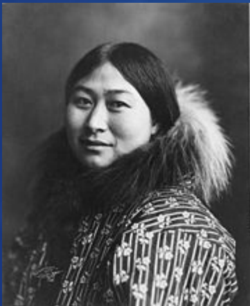
Эскимосская женщина, 1907 г.

По данным Переписи населения 2002 года численность эскимосов, проживающих на территории России, составляет 19 тысяч человек.