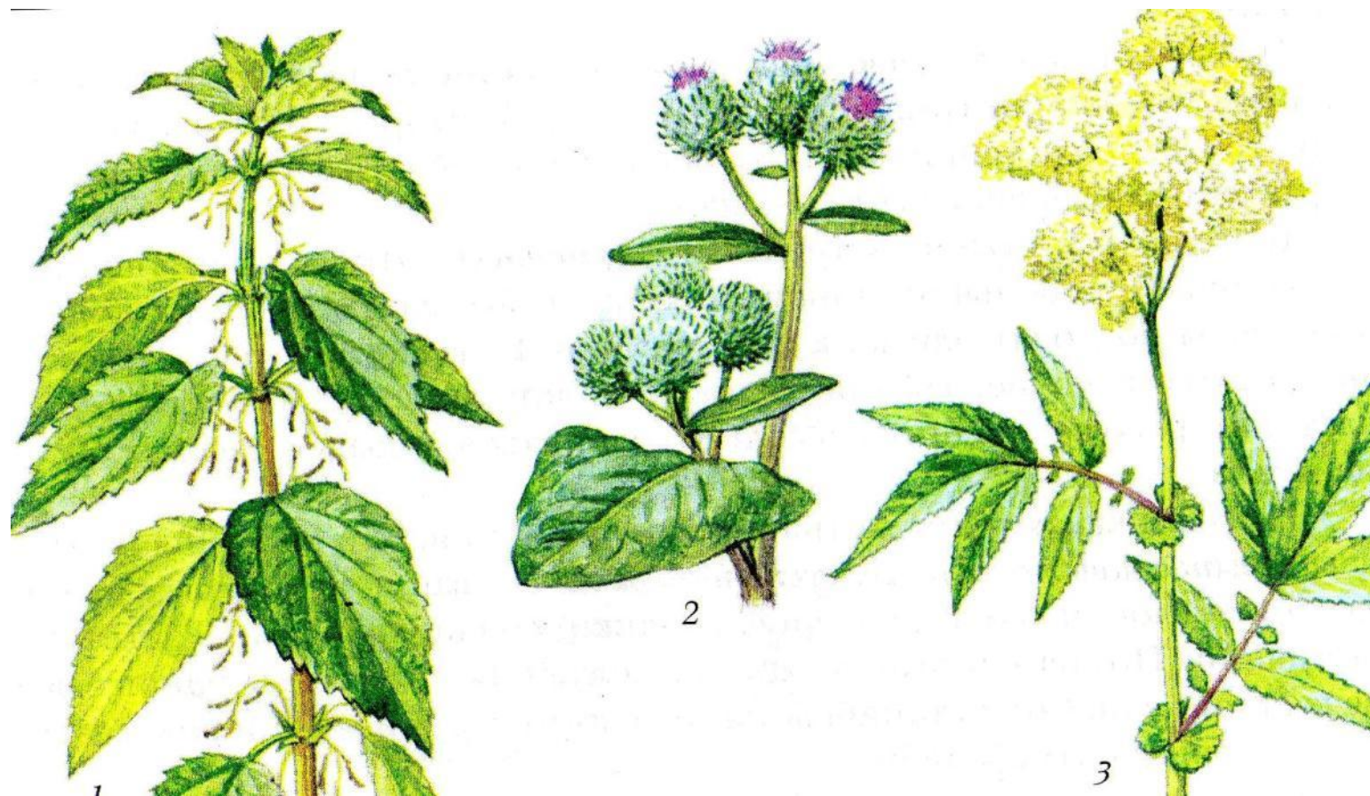
Рис.42. Растения-азотолюбы: 1 – крапива двудомная; 2 – лопух паутинистый; 3 – таволга вязолистная