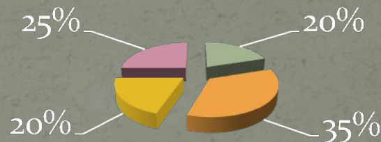
Количество получаемой с пищей энергии для учащихся 2-ой смены