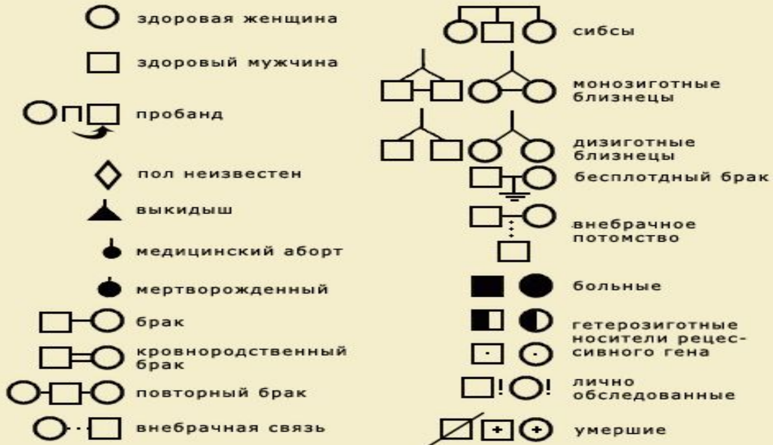
Рис. 7.6 Символы, используемые при составлении родословных