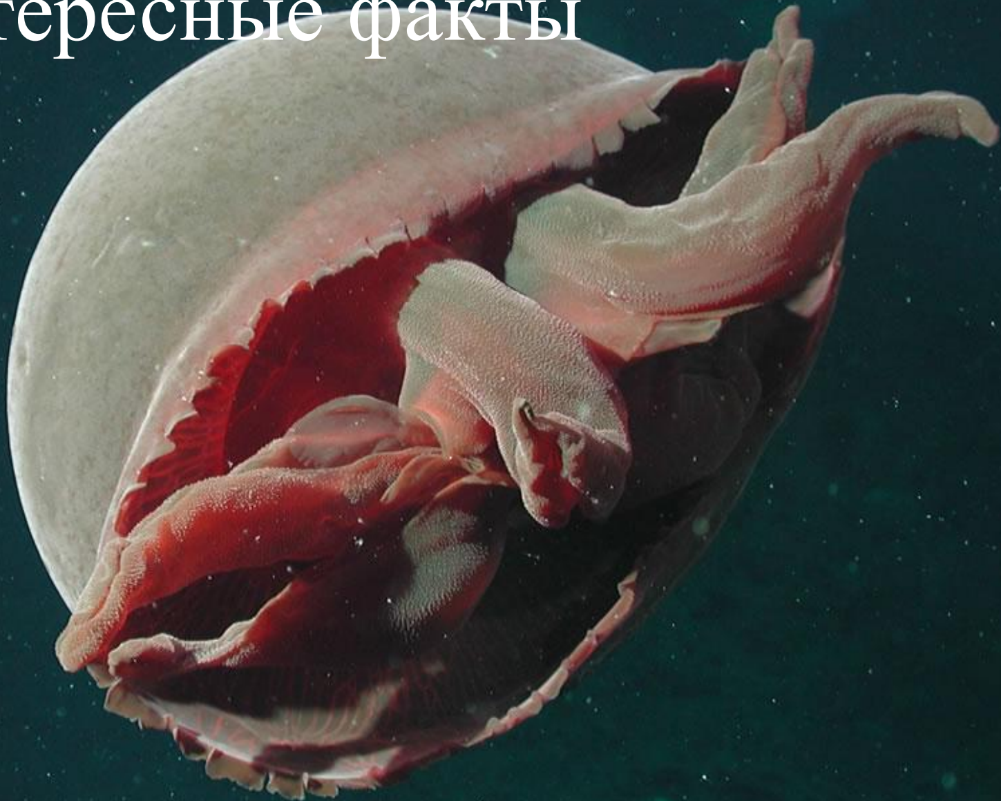
Большая красная медуза