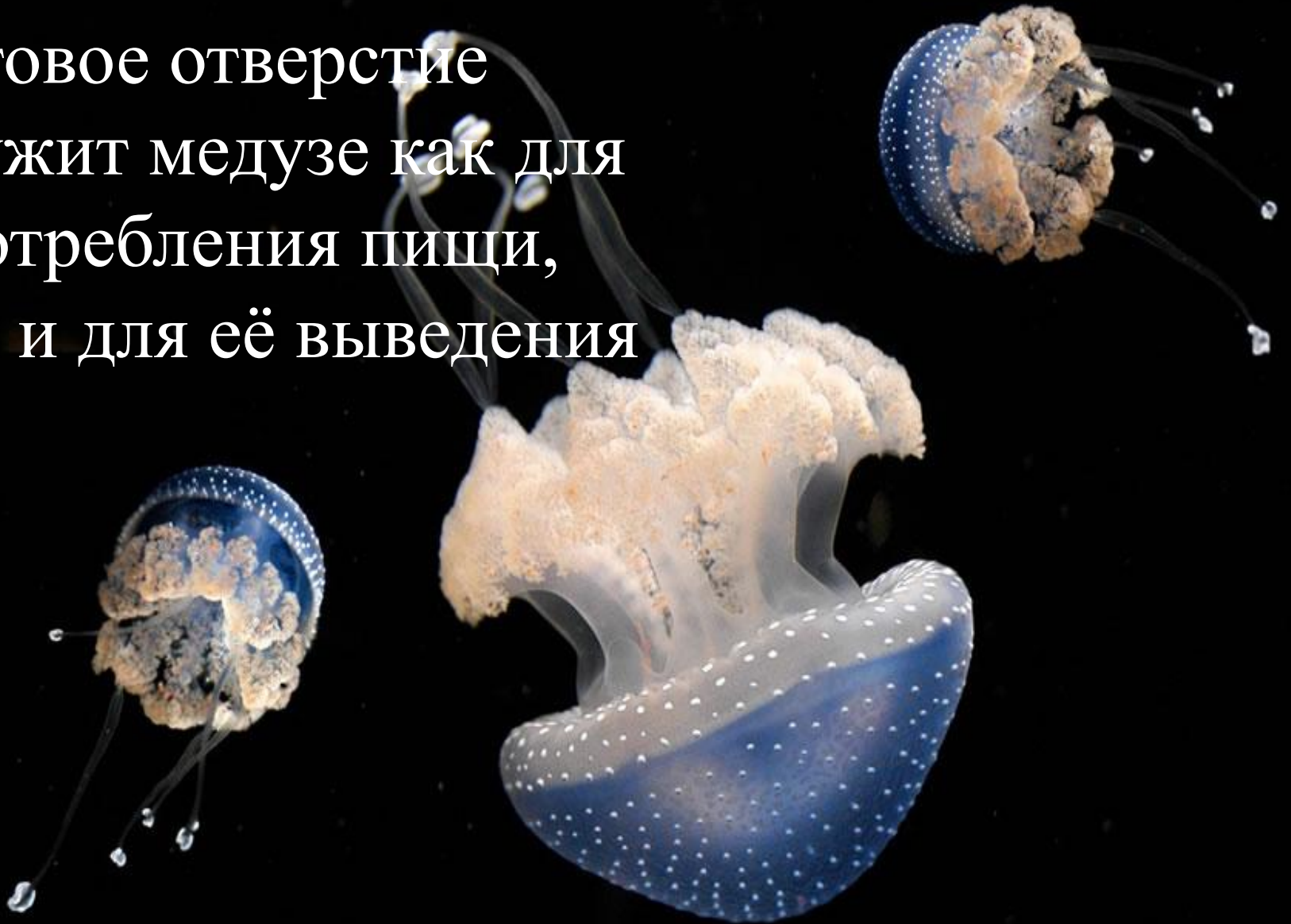
Пятнистая австралийская медуза (Phyllorhiza punctata)

Ротовое отверстие служит медузе как для употребления пищи, так и для её выведения