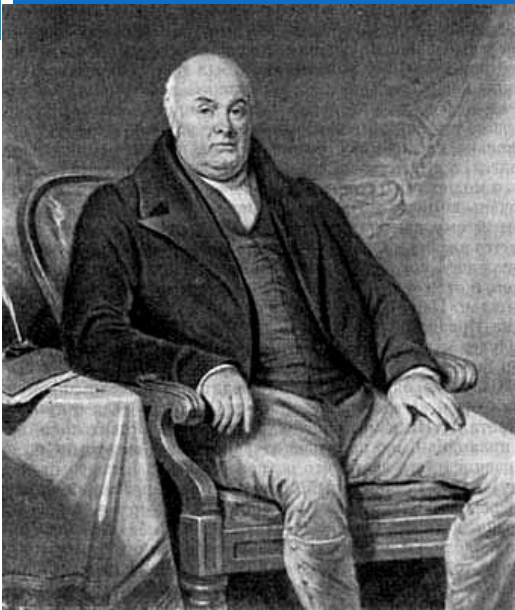
Отец Ч. Дарвина Роберт Уоринг Дарвин