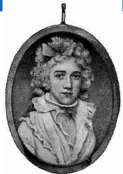
Мать Ч. Дарвина Сусанна Дарвин