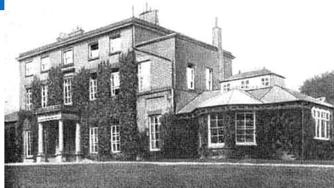
Дом в Шрусбери (Англия), где родился Ч. Дарвин