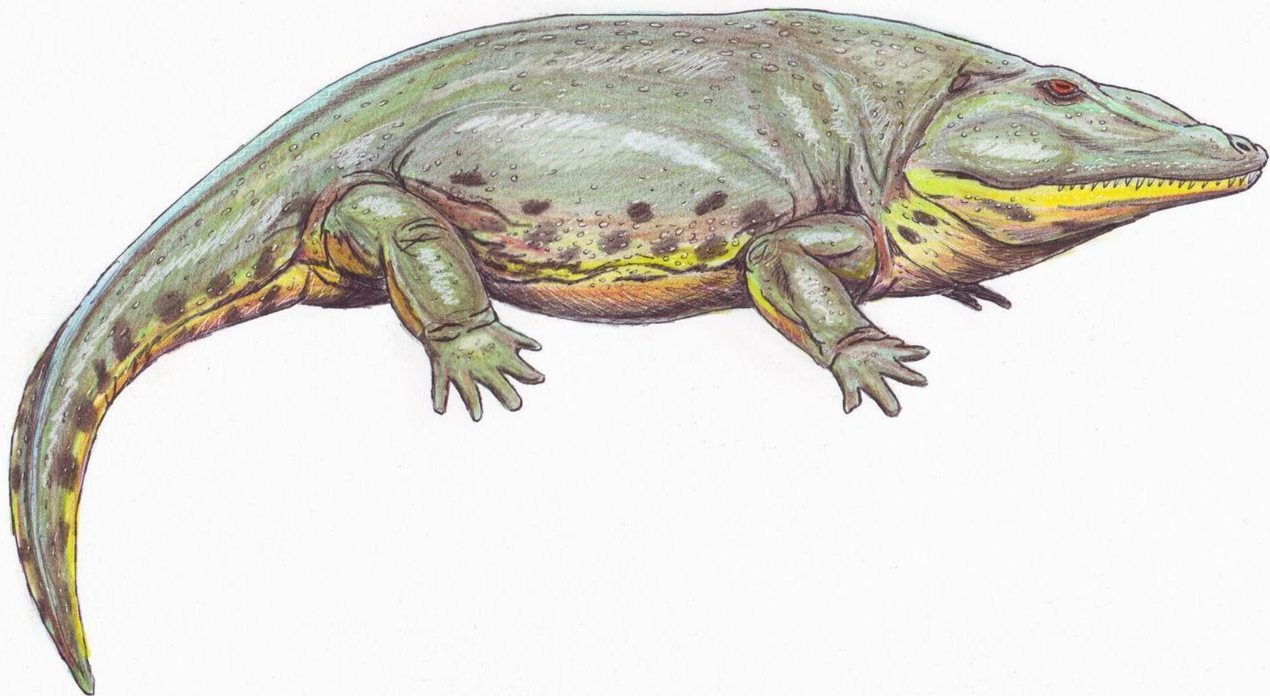
Ихтиостега (вышла на сушу)