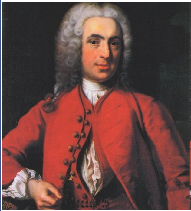
Карл Линней, 1707-1778