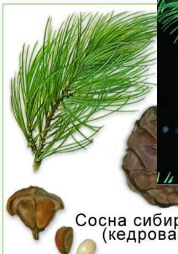
Сосна сибирская (кедровая)

Сосна обыкновенная, сосна сибирская (кедровая), ель,