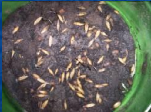
Через 2 дня