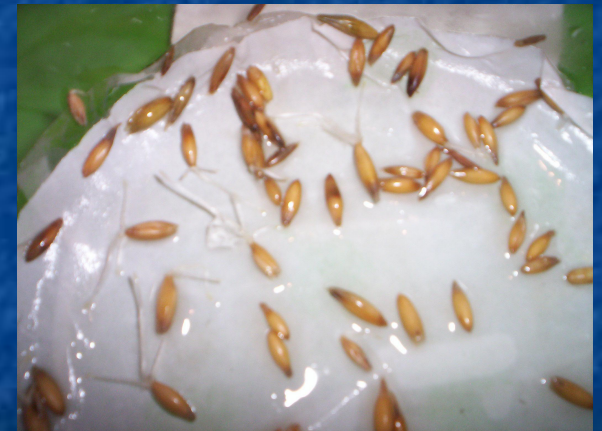
Через 2 суток