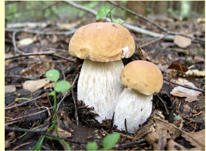
Белый гриб берёзовый