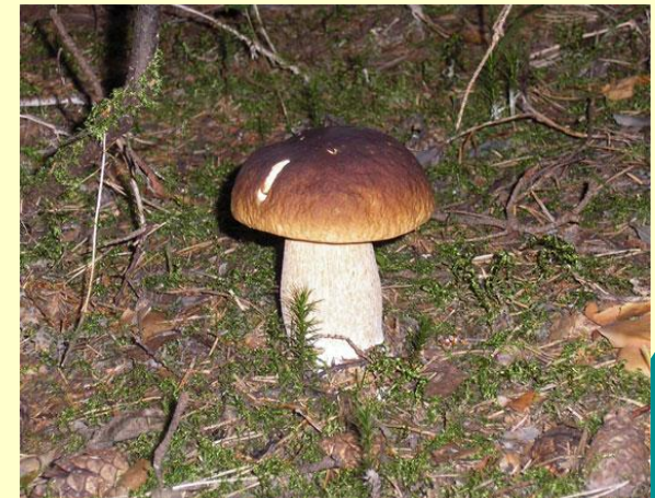
Белый гриб сосновый