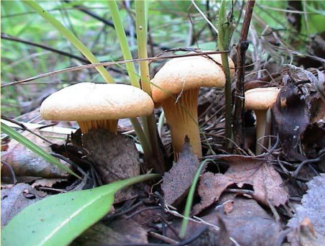
◆ Лисичка настоящая