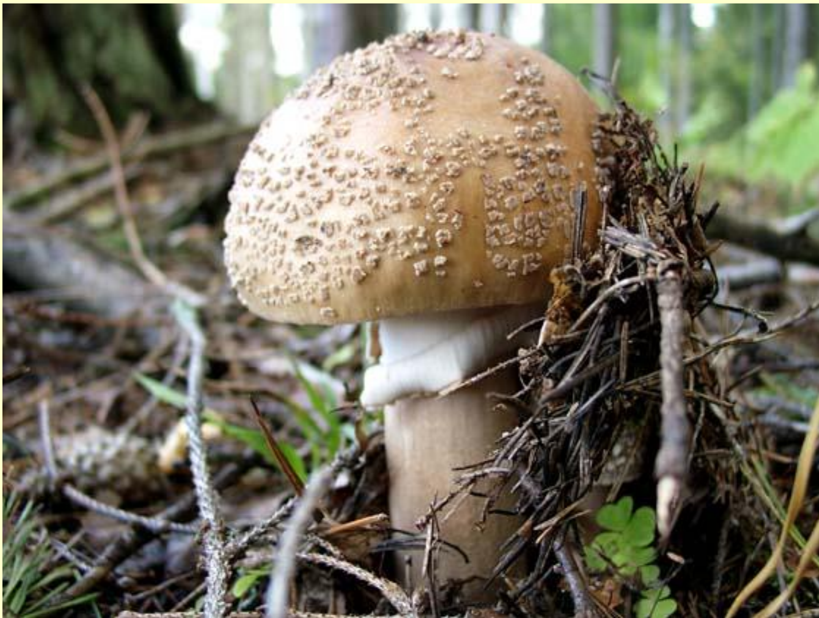
◆ Мухомор пантерный