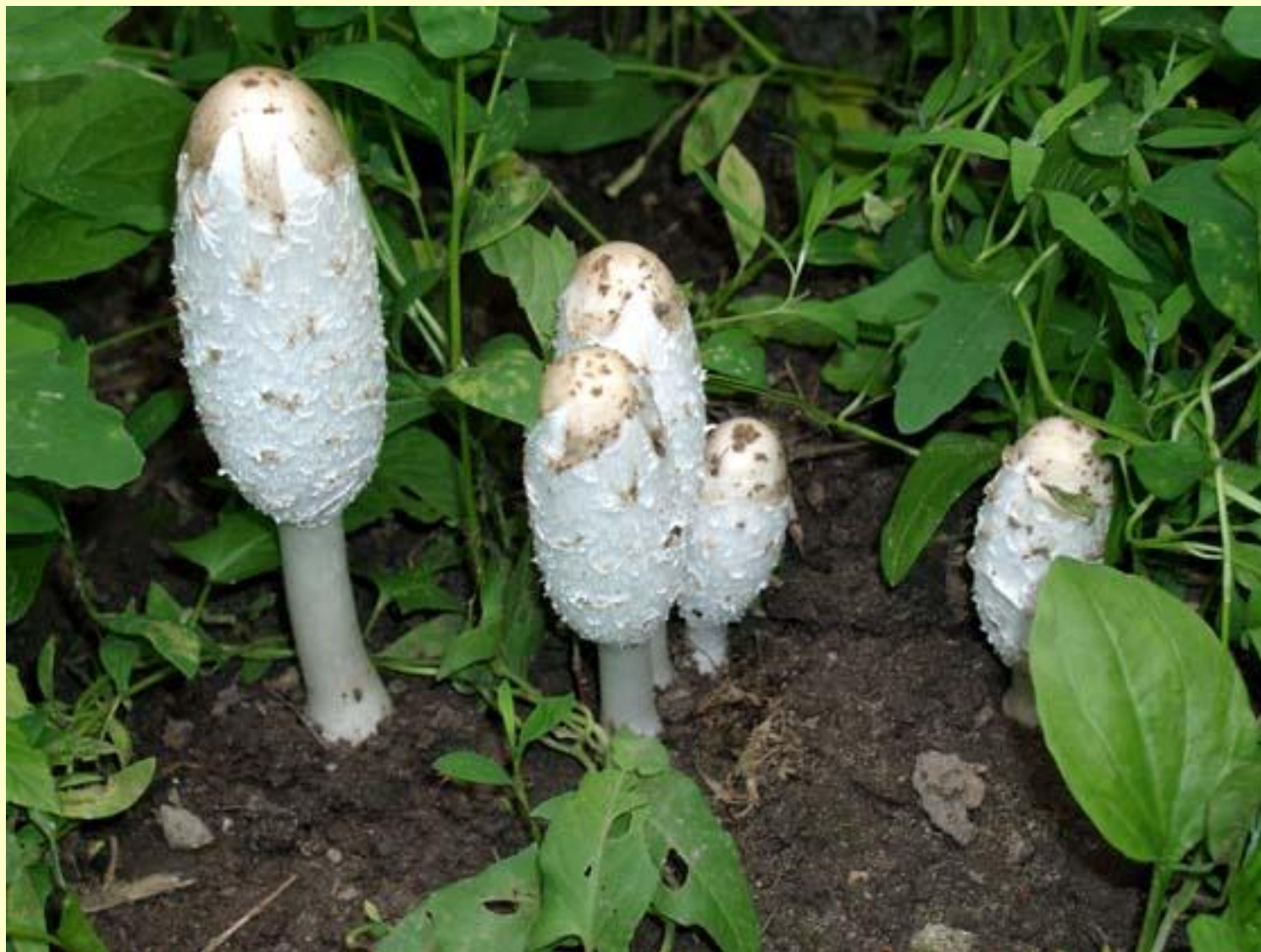
◆ Навозник белый