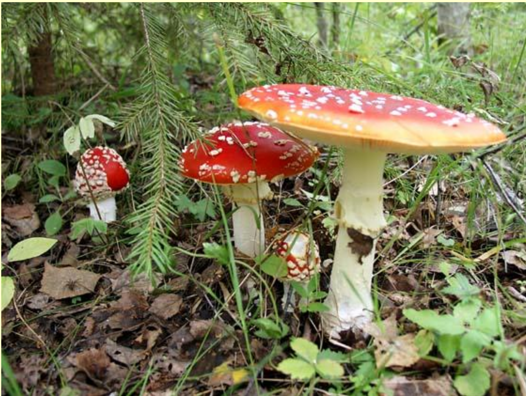
◆ Мухомор красный