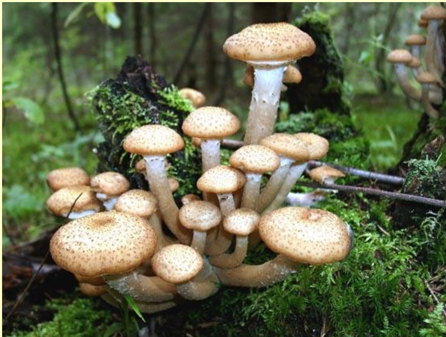
◆ Опёнок осенний