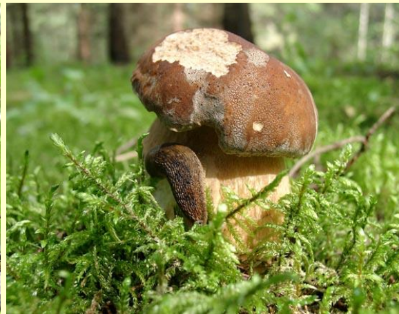
Белый гриб еловый