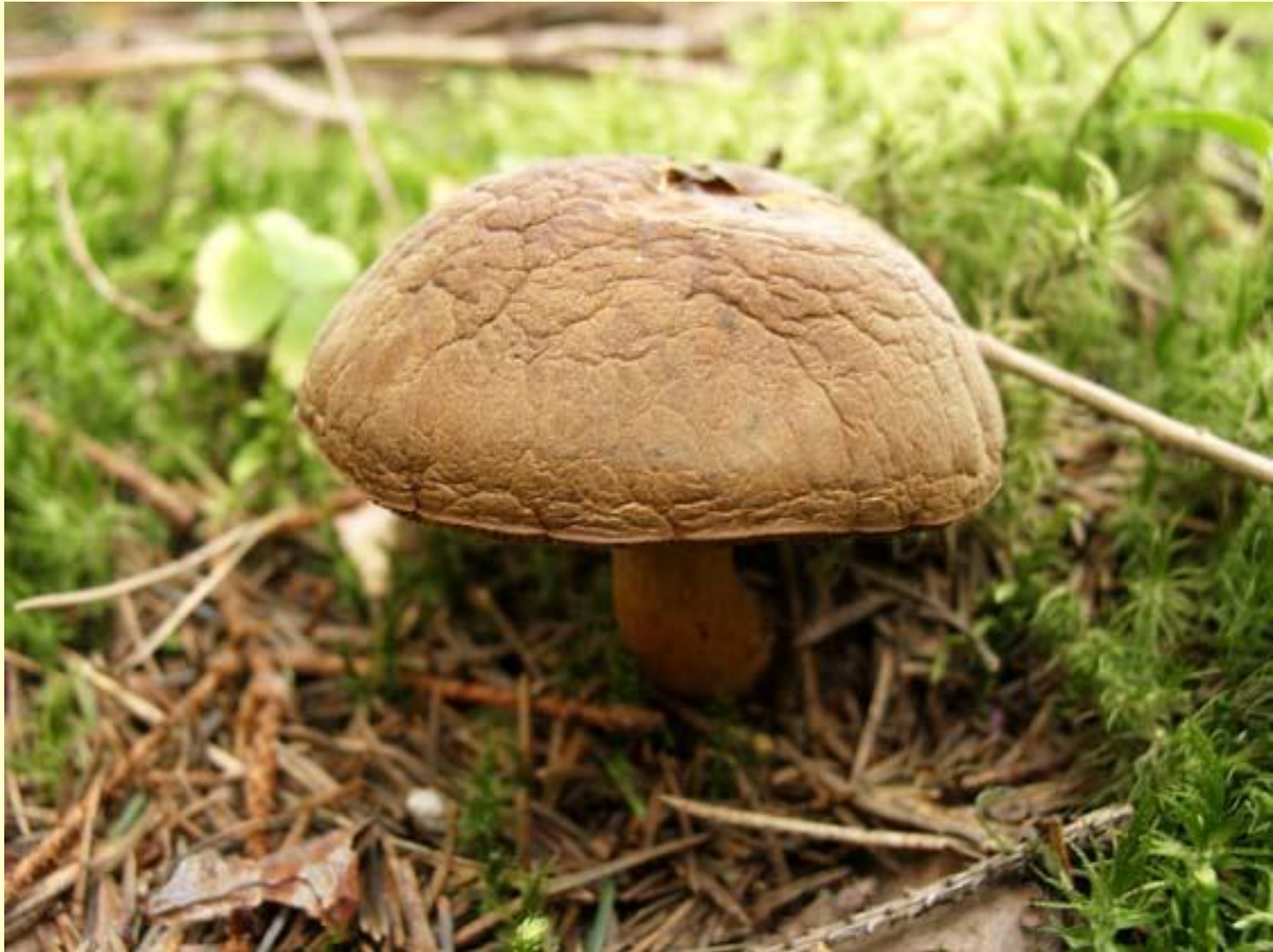
◆ Моховик зелёный