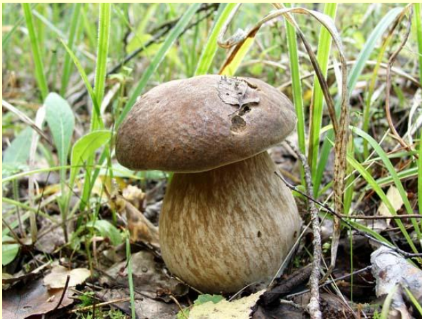
Белый гриб дубовый