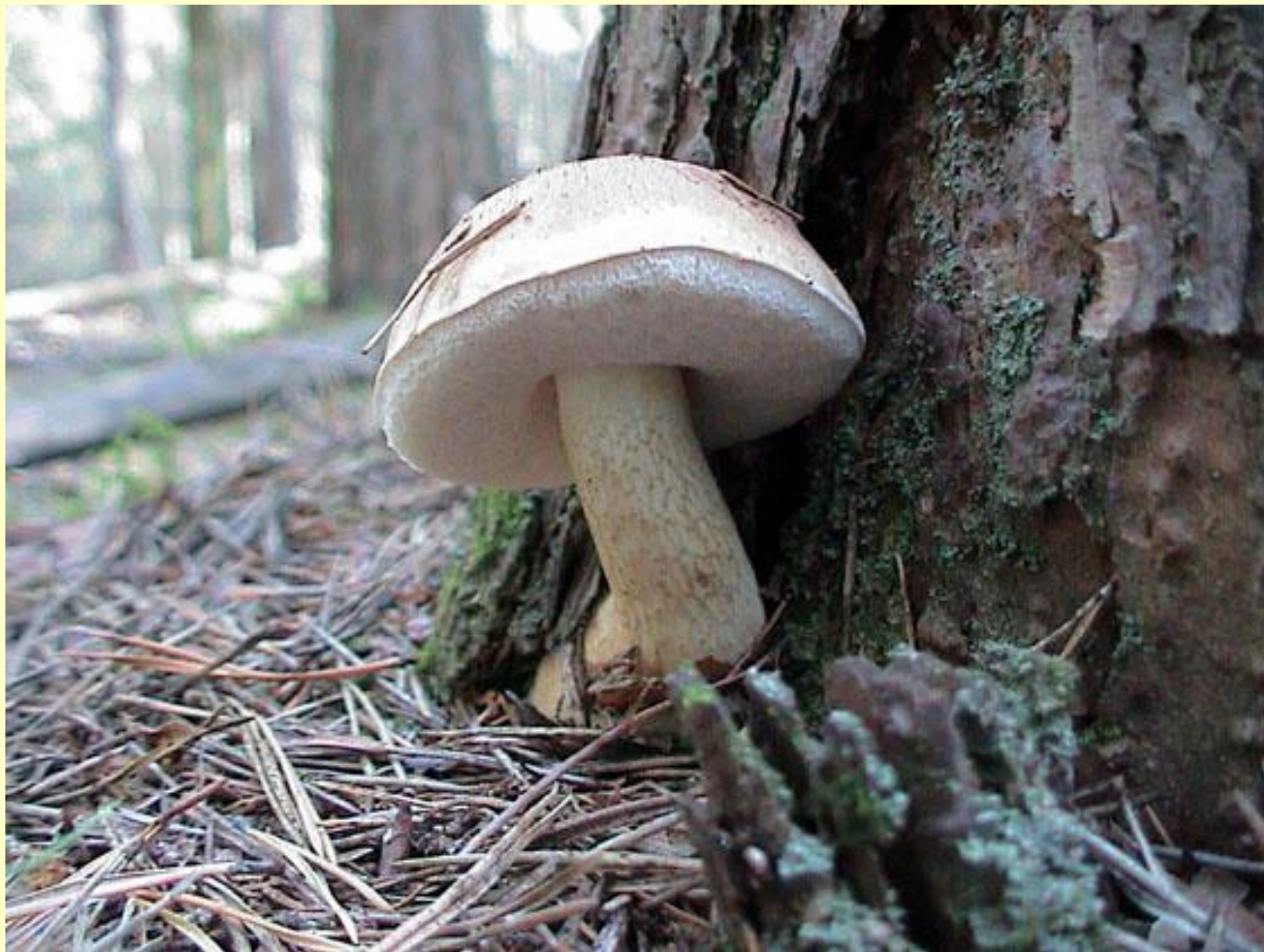
◆ Желчный гриб