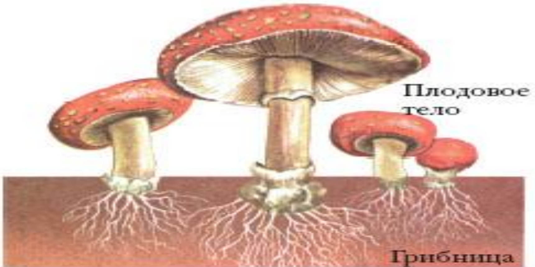
Рис. 121. Грибница и плодовое тело гриба