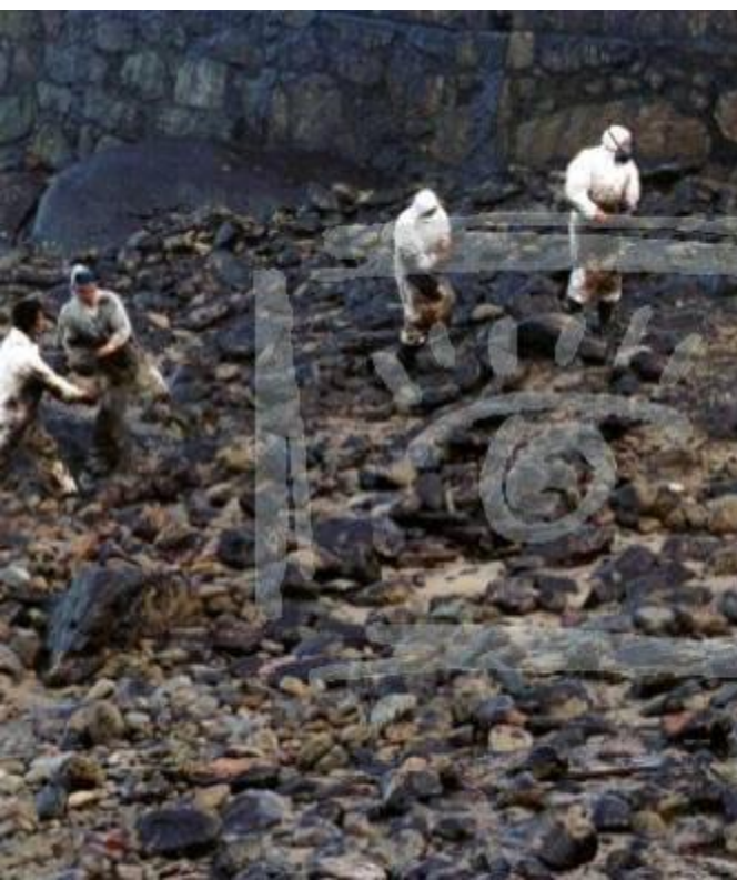
га Press рыболовецкой деревни Муксии, Коста дель Марте, Галисия, Испания. Под запретом на больше нефти ожидается в следующие два дня. Добровольцы, многие из Эстонии, помощью лопат, ведер и даже голыми руками. Нефть высокотоксична и канцер