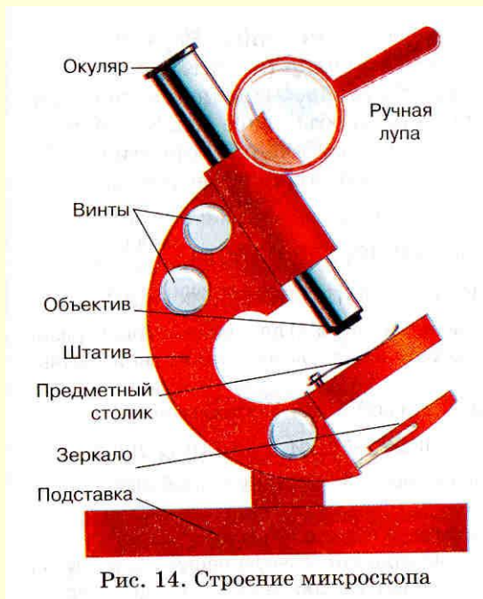
Рис. 14. Строение микроскопа