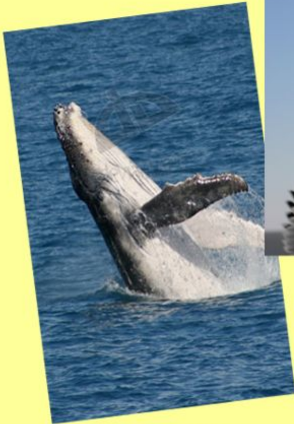
Кит - более 200 лет