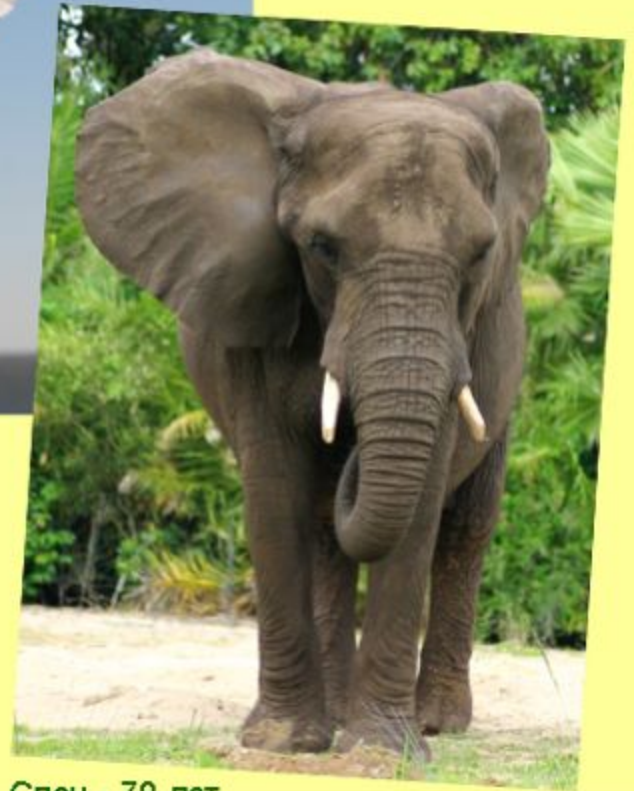
Слон - 70 лет