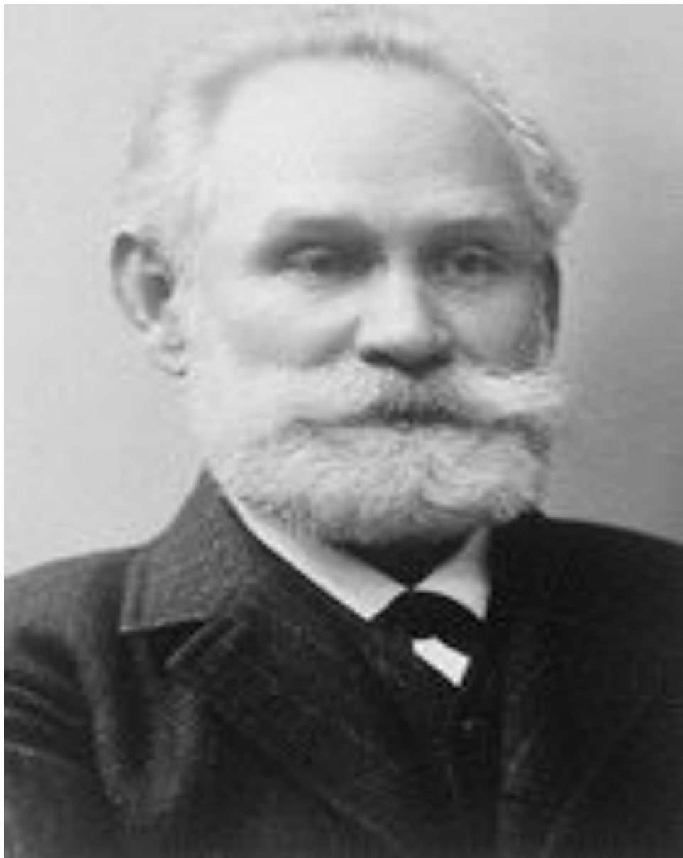
Павлов Иван Петрович (26 сентября 1849г - 27 февраля 1936г)