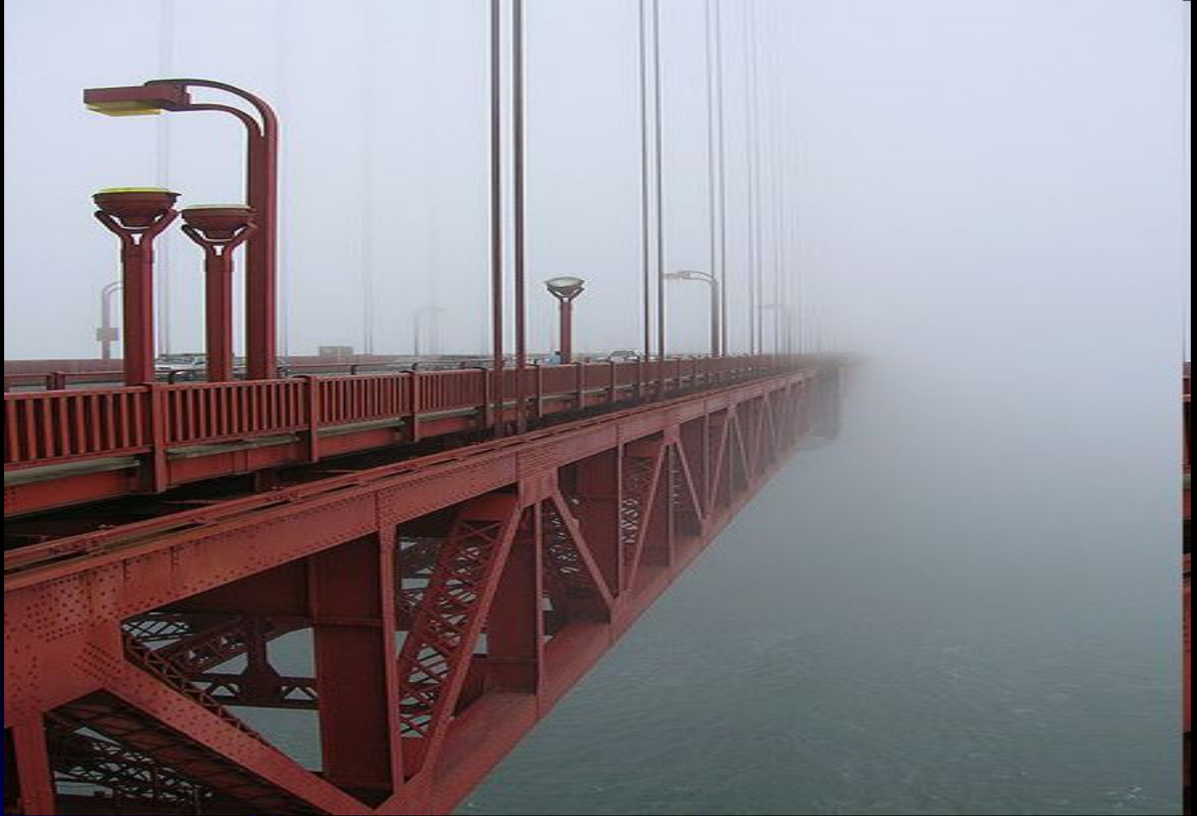
Знаменитый туман Сан-Франциско (Золотые ворота).