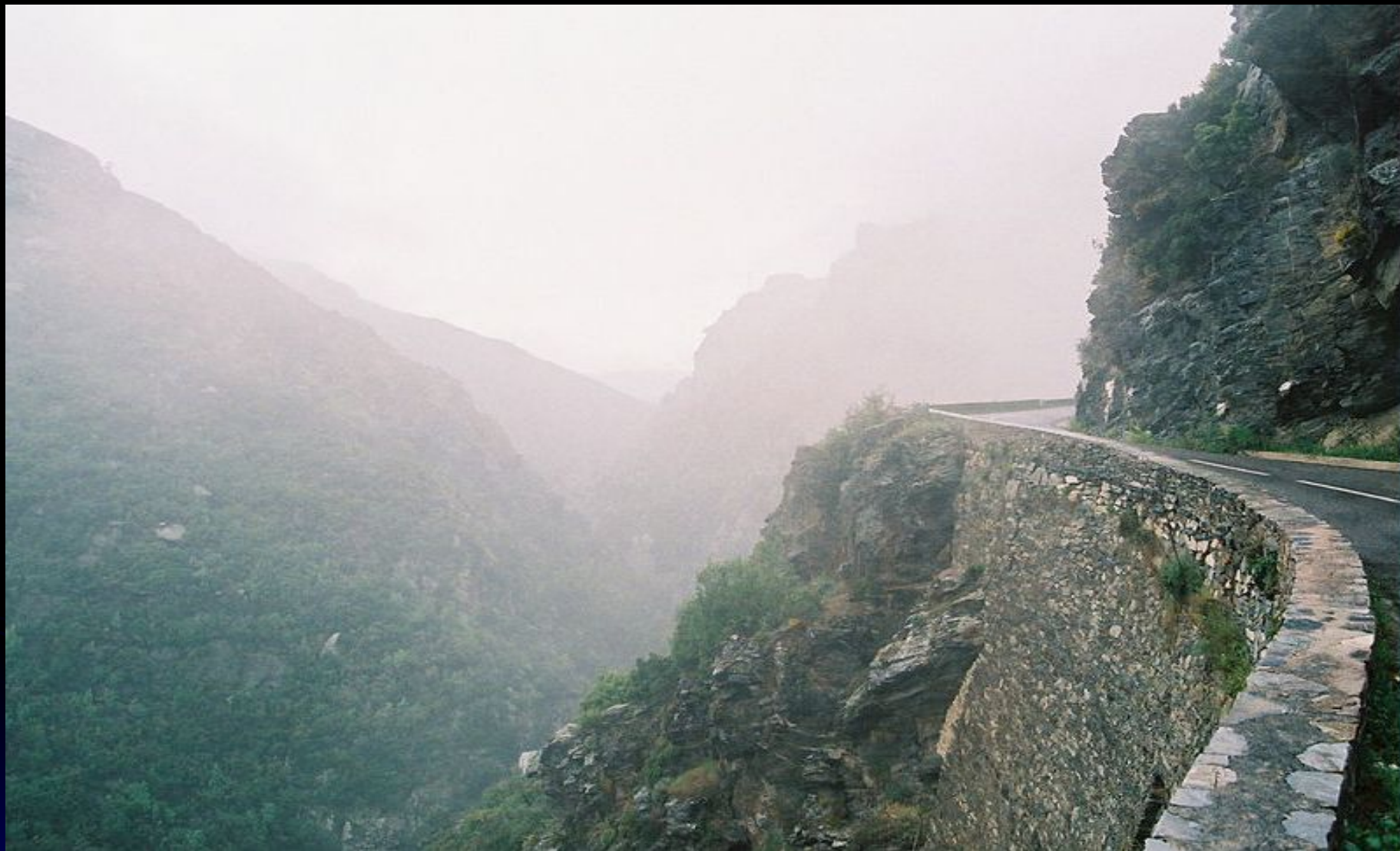
Горная дорога в тумане (шоссе D81 на Корсике).