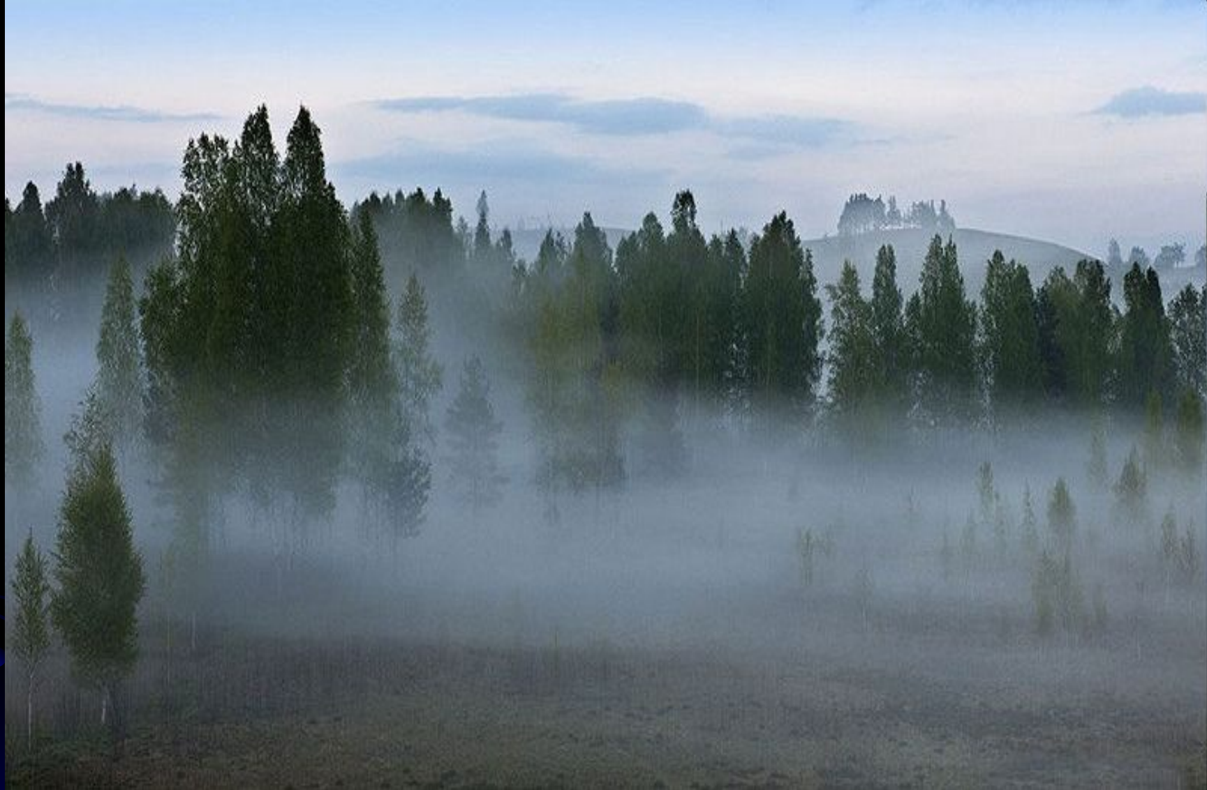
Туман в Изборской Долине (Псковская область).