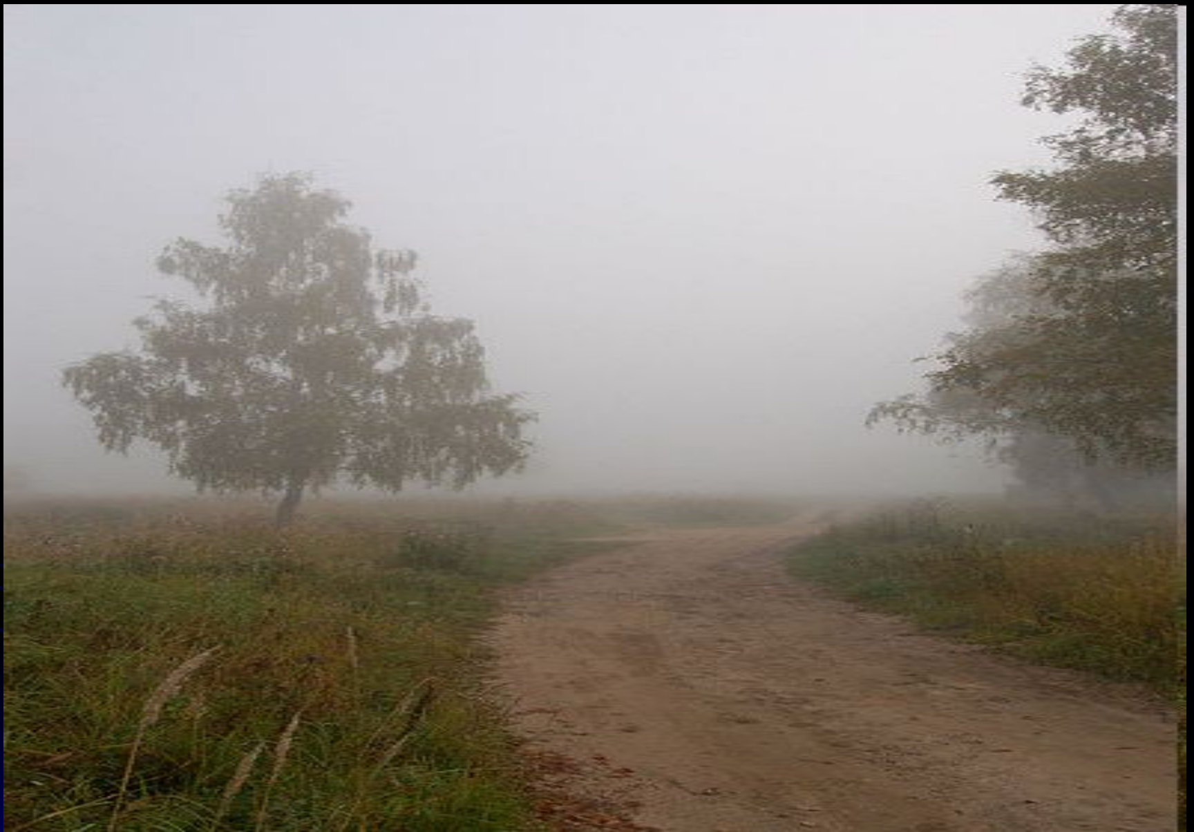
Просёлочная дорога в тумане (Подмосковье, Наро-Фоминск).