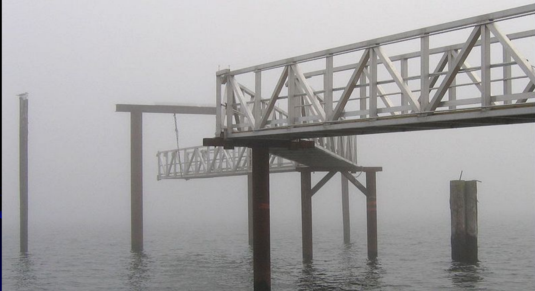
Пирс в тумане. Остров Ванкувер, город Сидней.