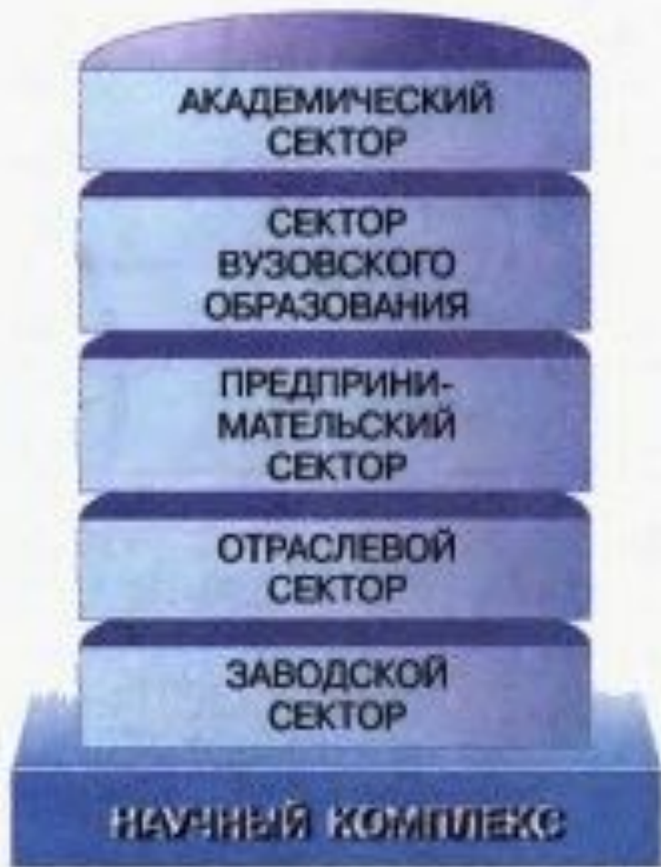
Рис. 24. Состав научно-го комплекса