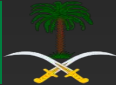
Герб Саудовской Аравии

ДЕВИЗ: «Нет Бога кроме Аллаха, и Мухаммад - Его пророк.»