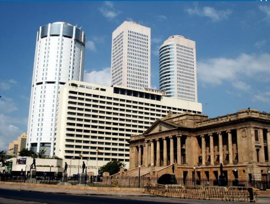
Colombo World Trade Center в Коломбо

Рост ВВП около 5 % в год. Шри-Ланка занимает 1-е место в Южной Азии по объёму ВВП на душу населения ($4300 в 2008 году).