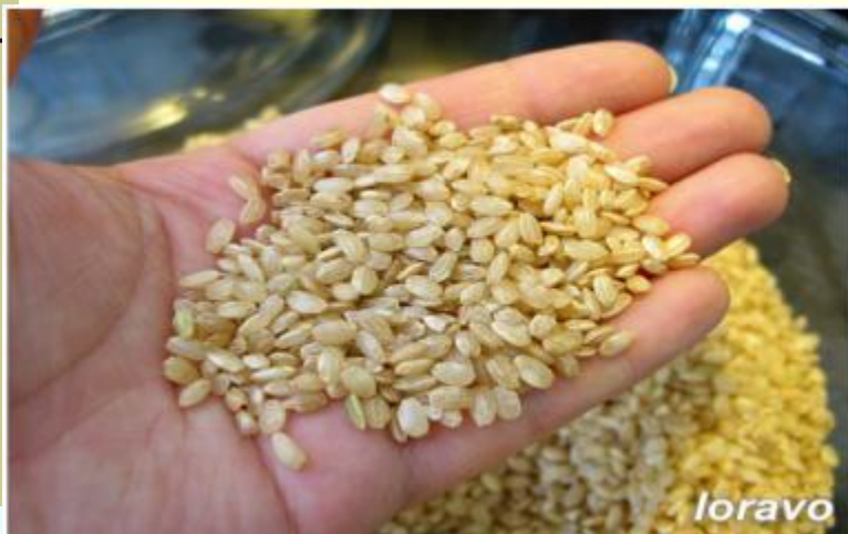
Рис - 9/10 мирового сбора приходится на страны Азии - Китай, Индию, Индонезию, Японию