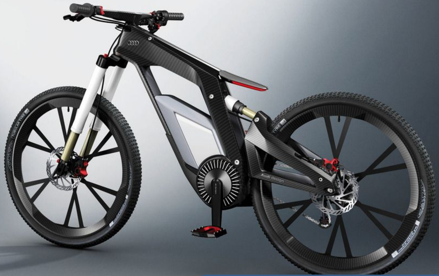
Электрический велосипед Audi