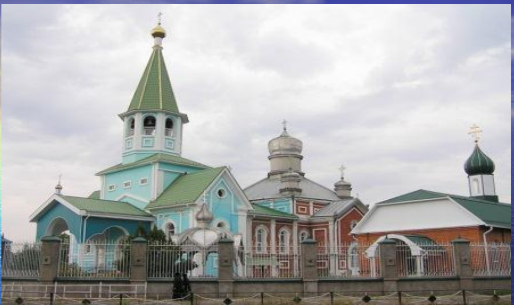
Свято-Троицкий кафедральный собор