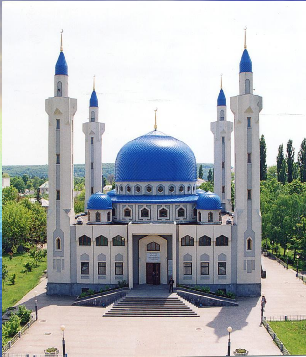
Соборная мечеть г. Майкопа.