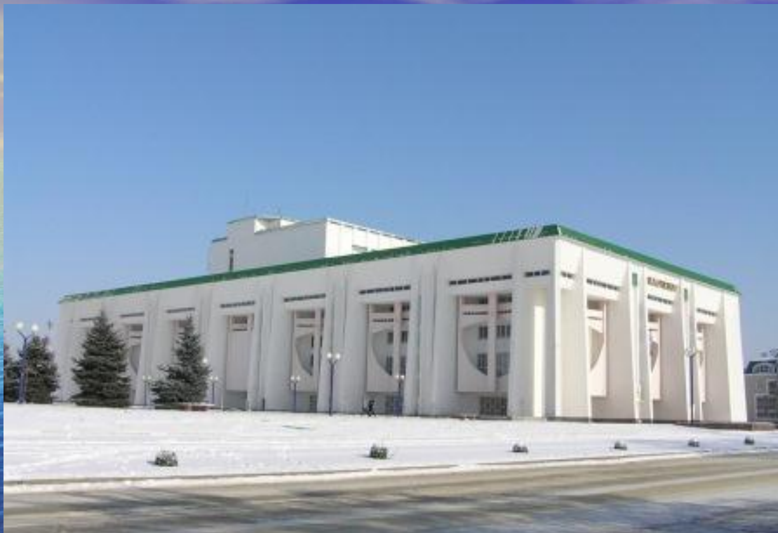
Государственная филармония Республики Адыгея