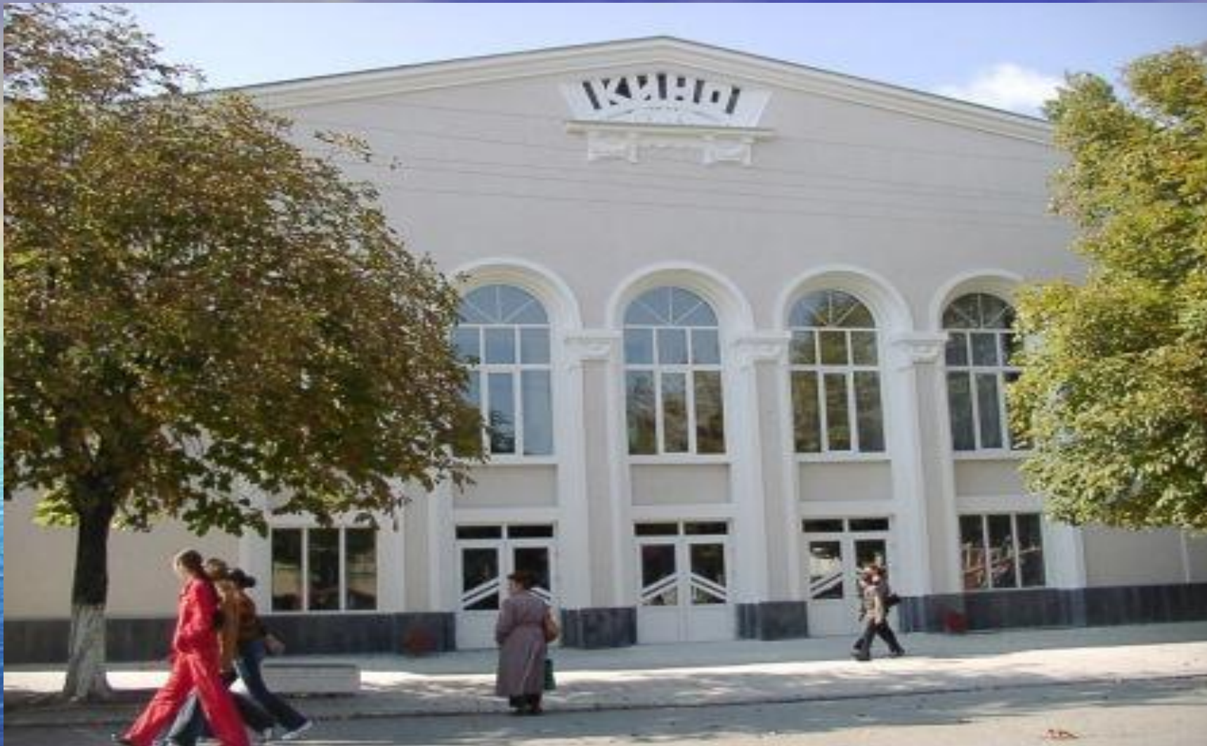
Городской дом культуры «Гигант»