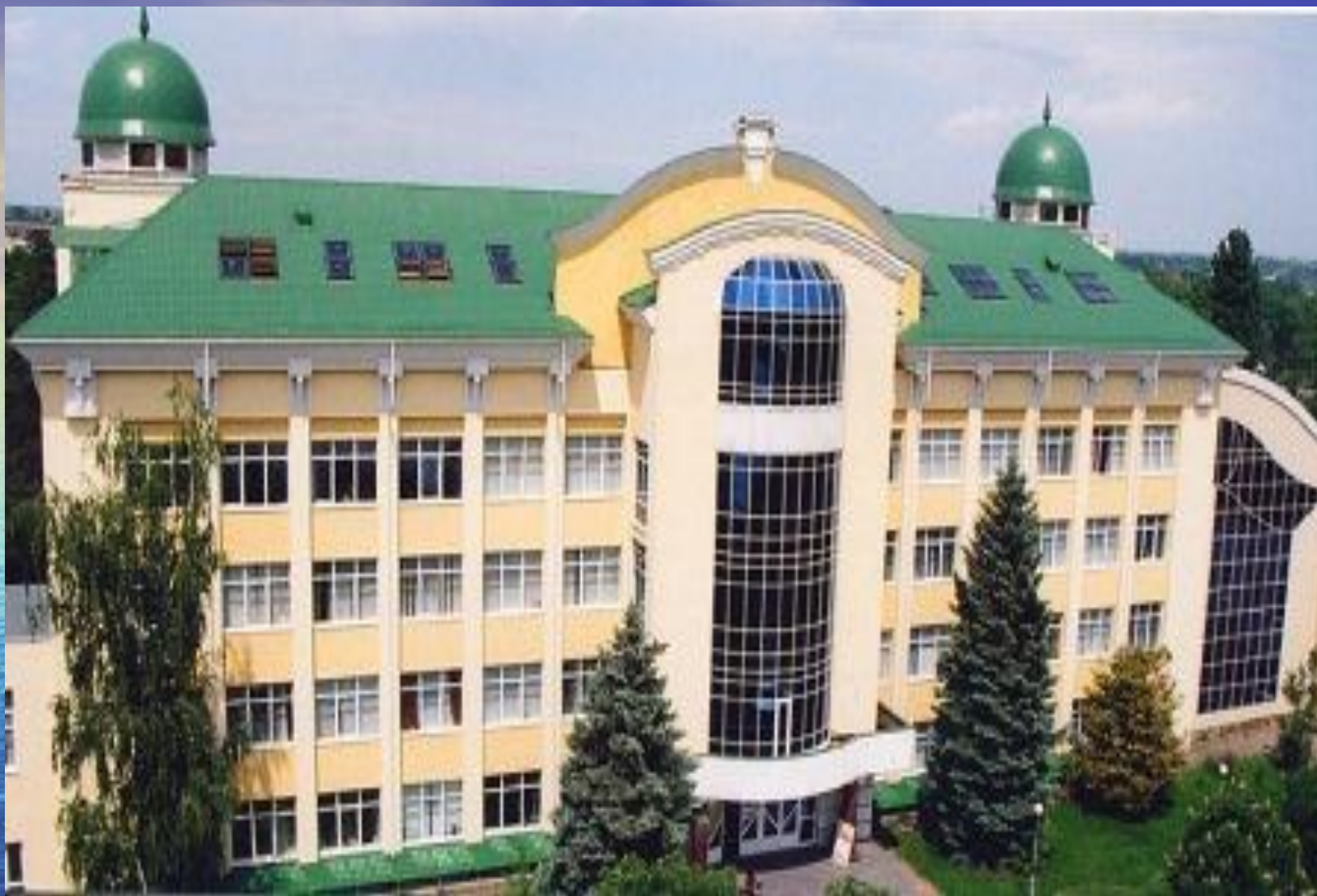
Адыгейский государственный университет