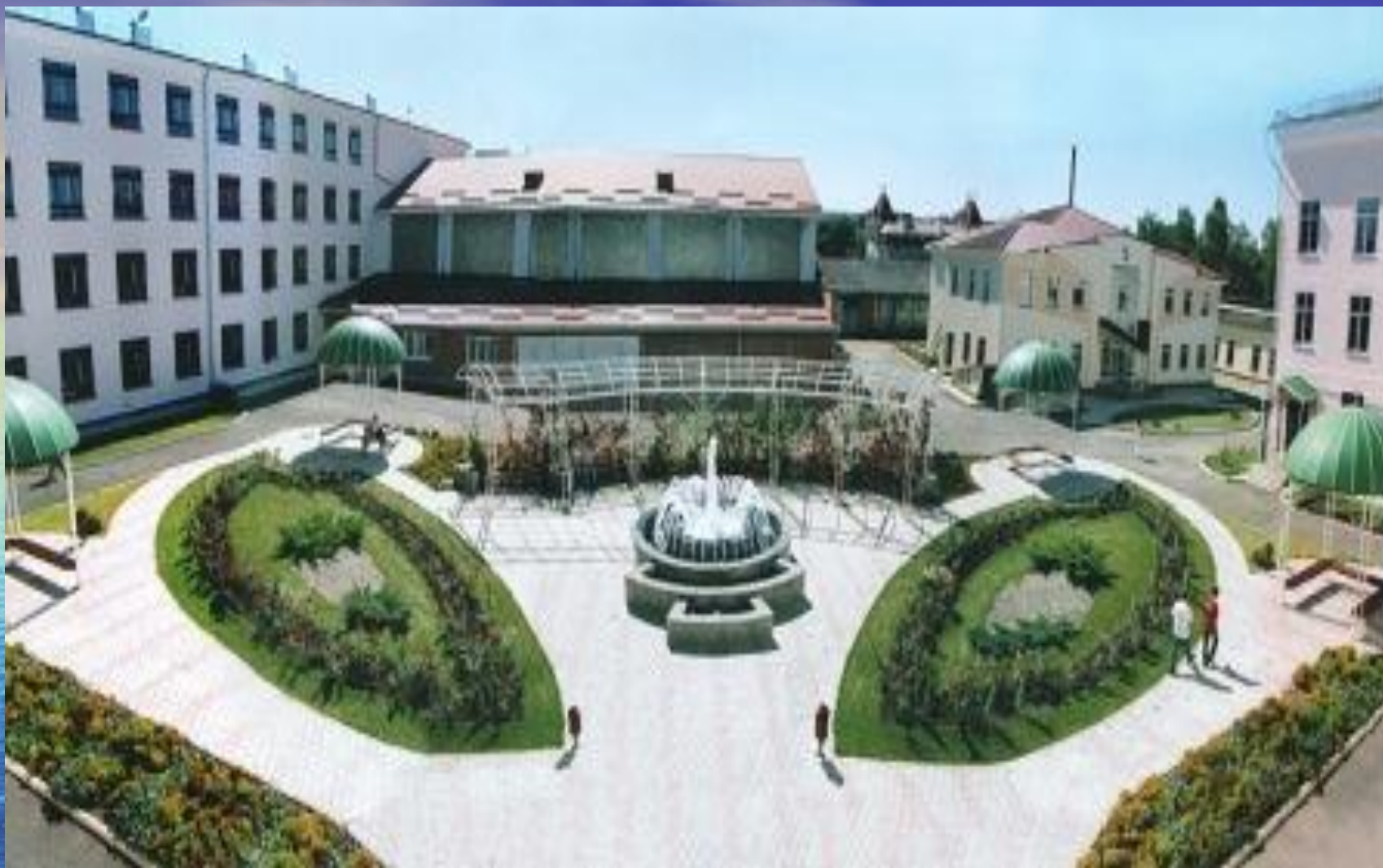
Внутренний дворик Майкопского государственного технологического университета