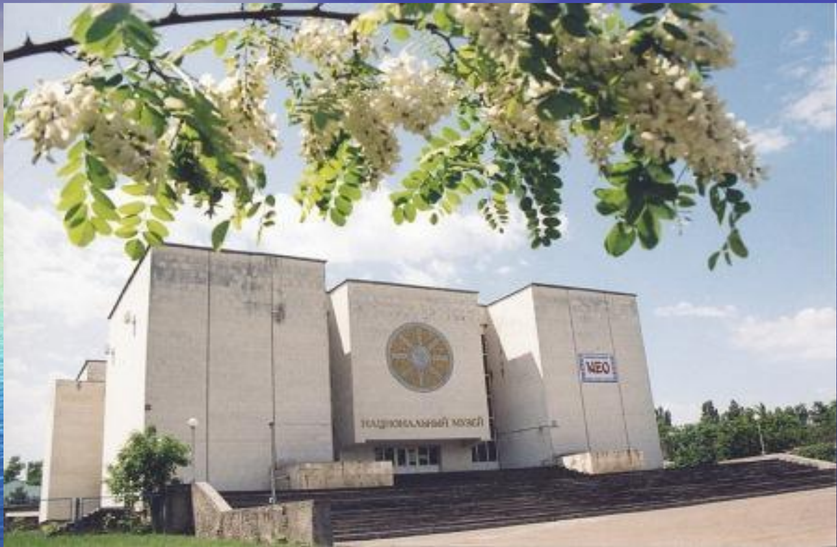
Национальный музей Республики Адыгея