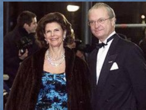
Королева Сильвия и король Карл XVI Густав