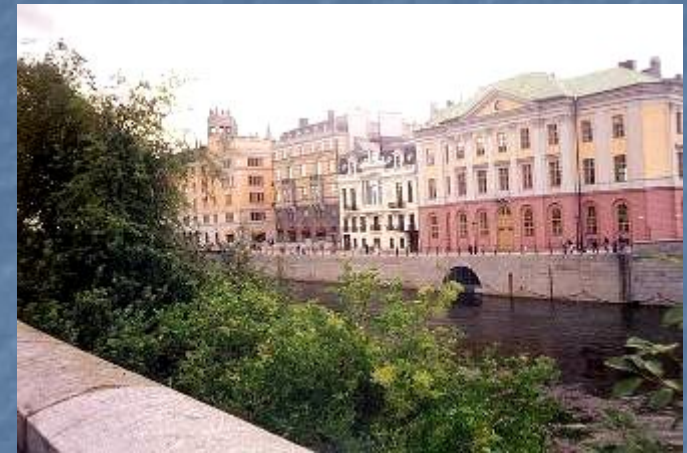
Панорама Гамла-Стана — средневековой части Стокгольма, основанного в 1252 году.