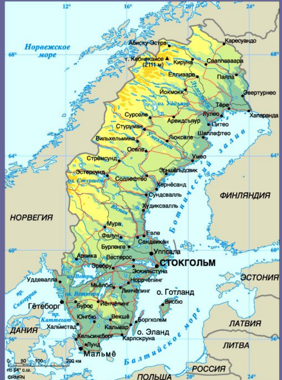
Государства – соседи Швеции