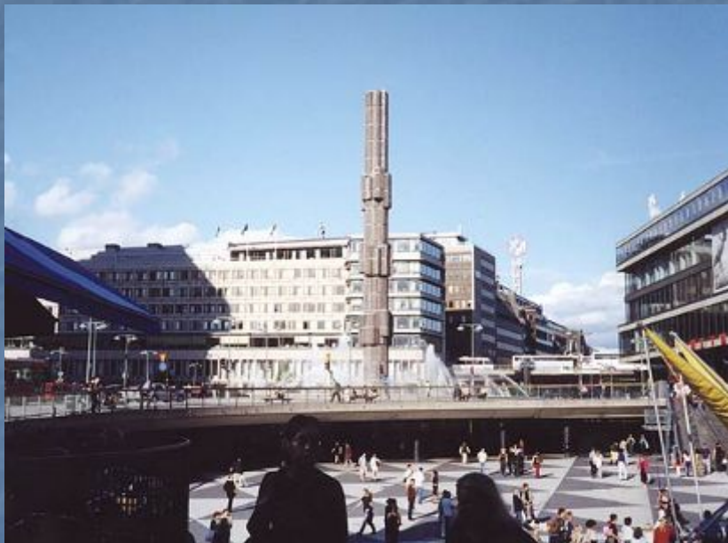
Главная улица города — Кунгсгатан (Королевская).

Лежащий на северном берегу протока Норстрем район Нормальм («Северное предместье») служит главным административным, торговым и культурным центром столицы. Здесь расположены новое здание риксдага, правления крупнейших банков и промышленных концернов, большие универмаги, гостиницы и рестораны, оперный и драматический театры, центральный вокзал, многоэтажные жилые дома.