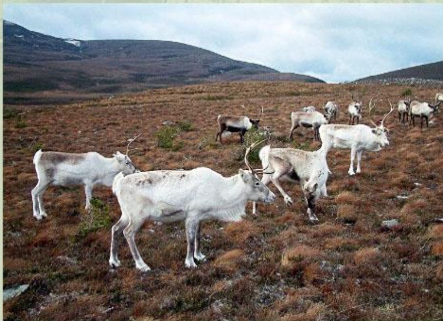
Традиционное занятие народов Севера - оленеводство.