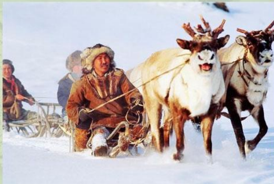
Оленья упряжка - основное средство передвижения в Арктике.