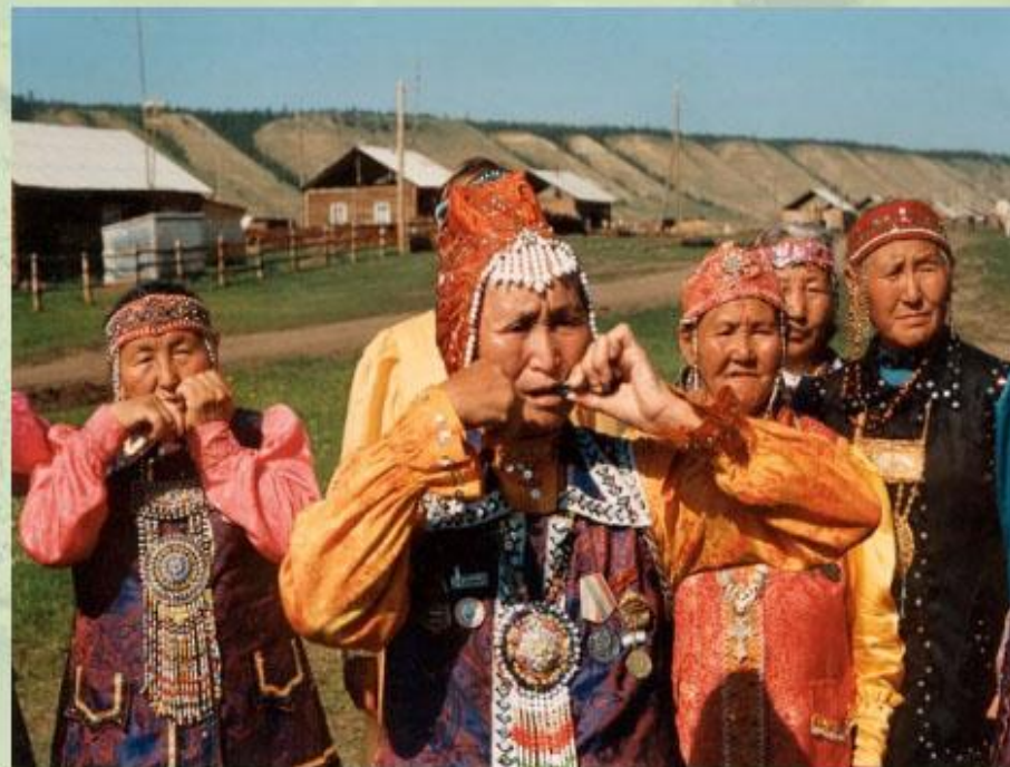
Национальный инструмент народов Севера - хомус.