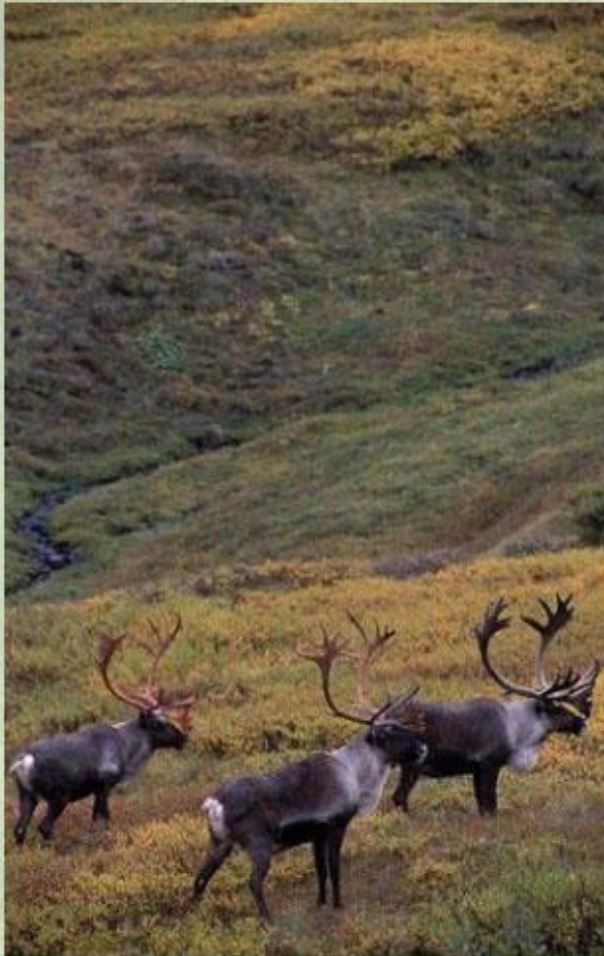
Карибу - американский северный олень.

В настоящее время воздействие человека стало поистине опустошающим: за первые тридцать лет XX в. численность карибу в Северной Америке сократилась с 3 млн. до 200 тыс. голов! Теперь охота на оленей ограничена законами США и Канады. В Северной Сибири оказался на грани исчезновения ценный пушной зверь - соболь, которого удалось спасти, только взяв под охрану закона.