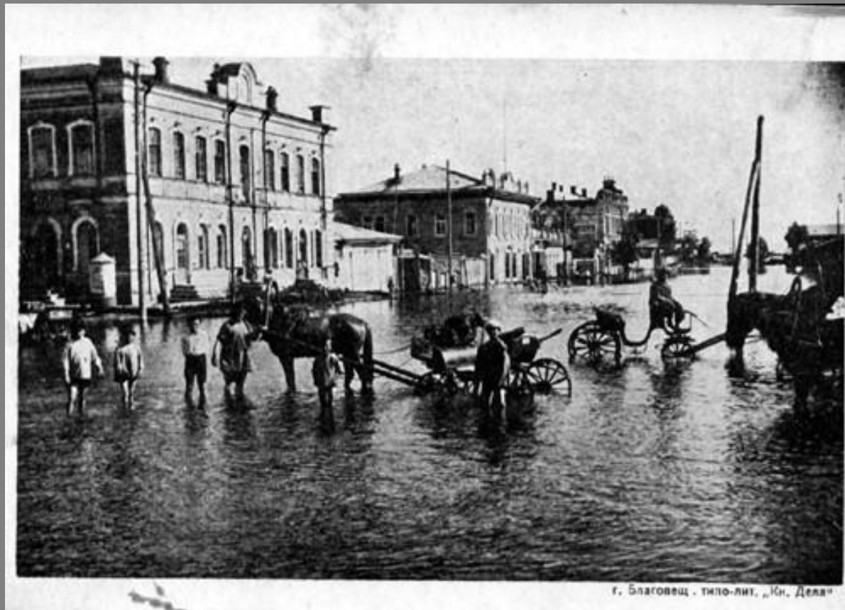
г. Благовещ . типо-лит. „Юн. Деля“