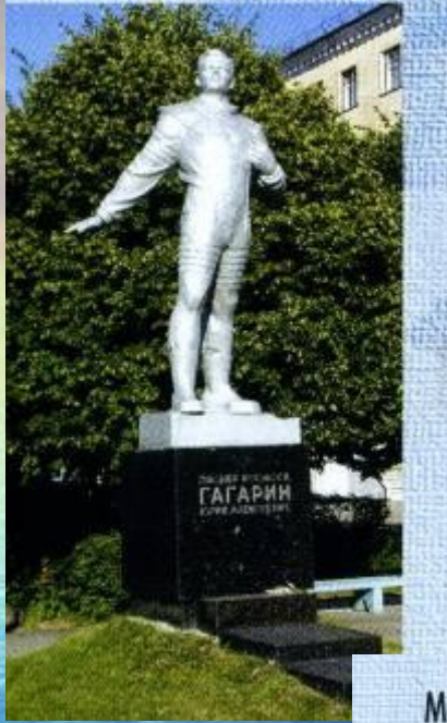
Памятник Ю.А. Гагарину