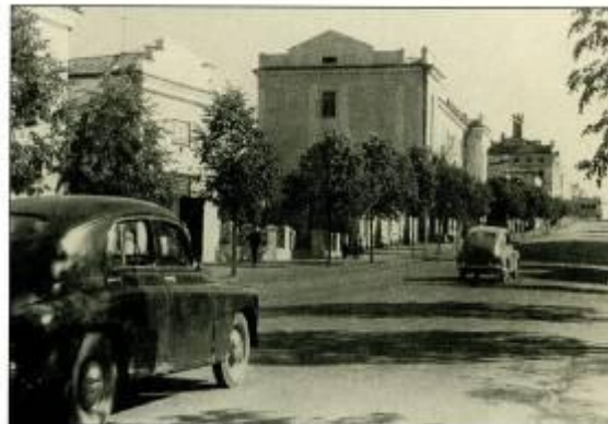
Ул. К. Маркса, начало 1960-х годов.