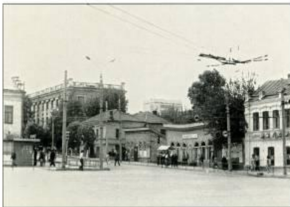
Красная площадь, август 1975 г.