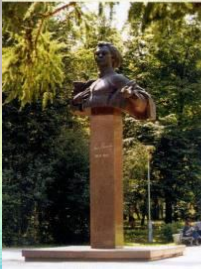
Михаил Сеспель - основоположник чувашской советской поэзии