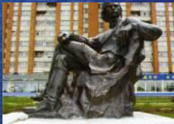
Памятник А.М. Горькому