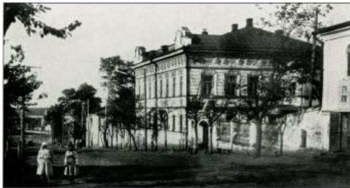
Ул. К. Маркса, 1924 г.