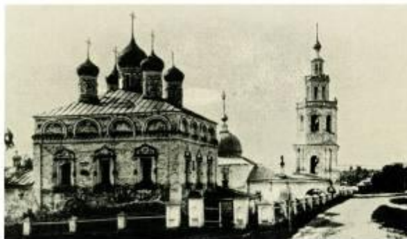
Церковь Михаила Архангела, начало XX в.