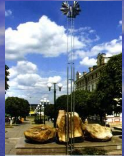
"Птица счастья" и Таганаит - камень солнца и любви.