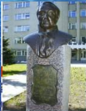
Памятник П.Е. Егорову - архитектору, автору ограды Летнего сада в Санкт-Петербурге