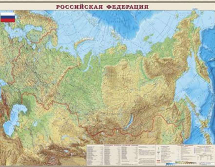
Физическая карта России (интерактивная карта).

География - очень древняя фундаментальная наука. Она возникла ещё в те незапамятные времена, когда человечество только начинало открывать и осваивать новые территории. Активное развитие география получила в античных обществах: хорошо известно, что географическими исследованиями занимались многие древнегреческие философы.