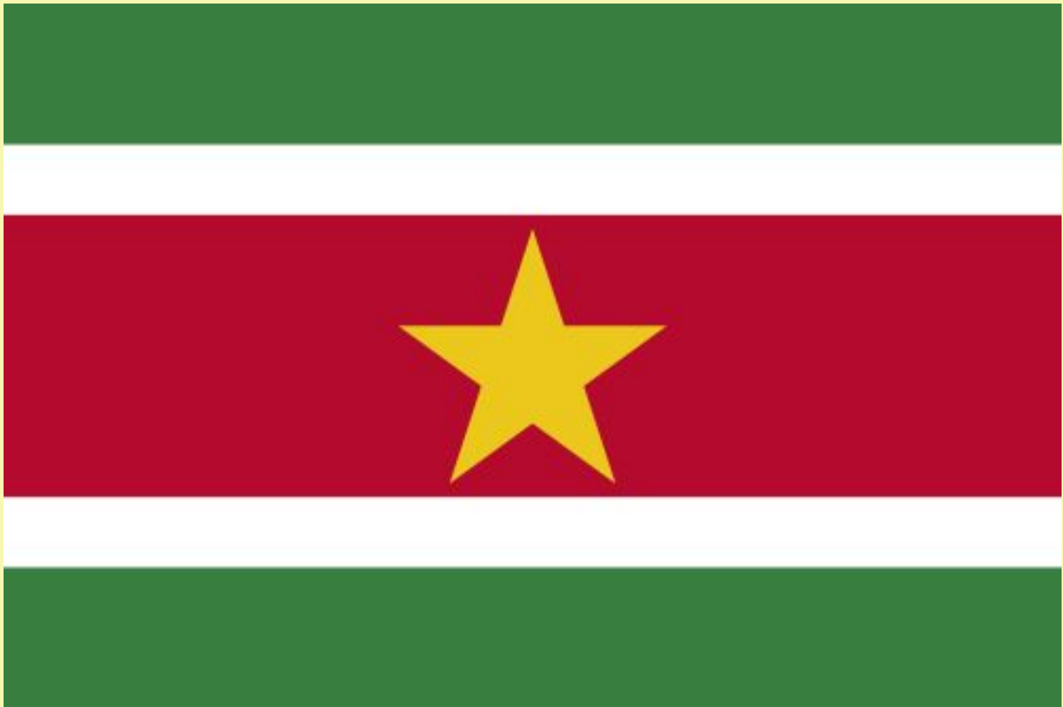
• Флаг Суринама