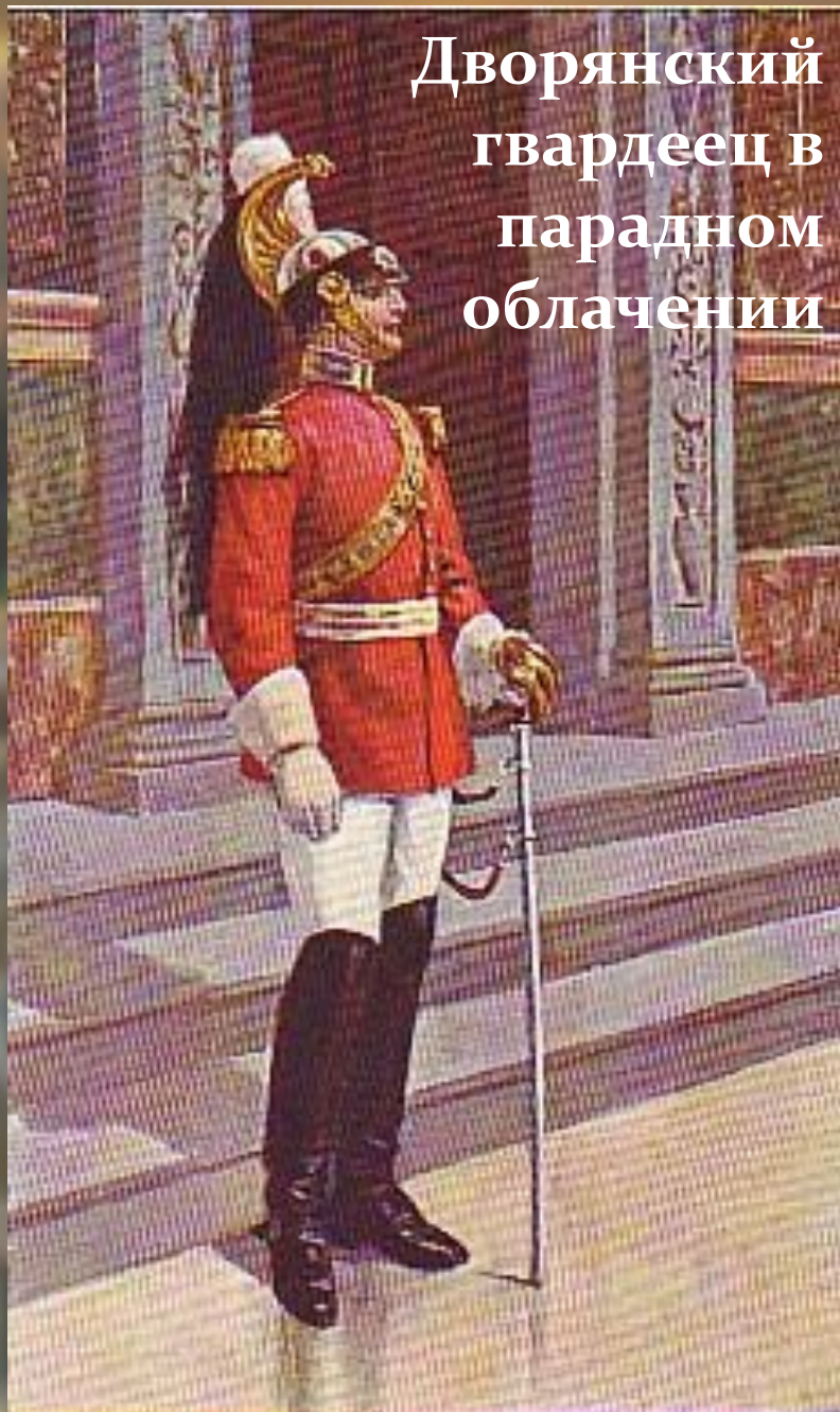
Дворянский гвардеец в парадном облачении