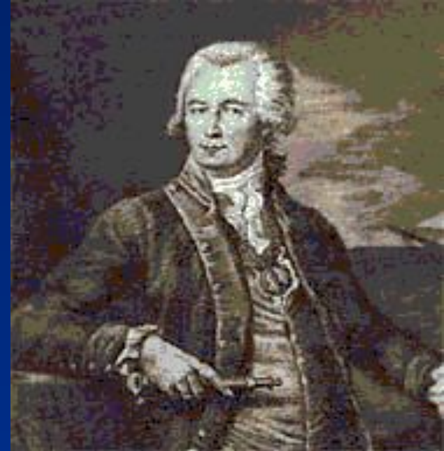
• Г.И. Шелихов.