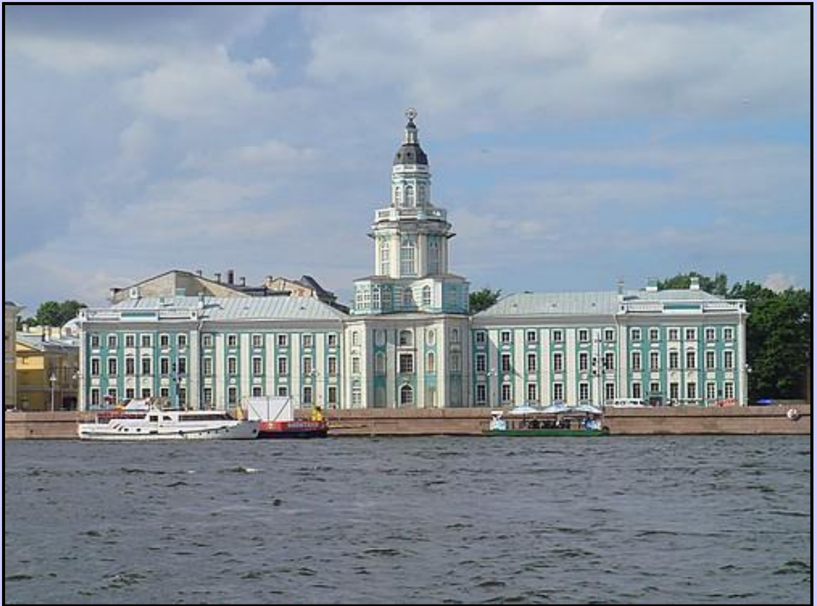
Музей антропологии и этнографии им. Петра Великого