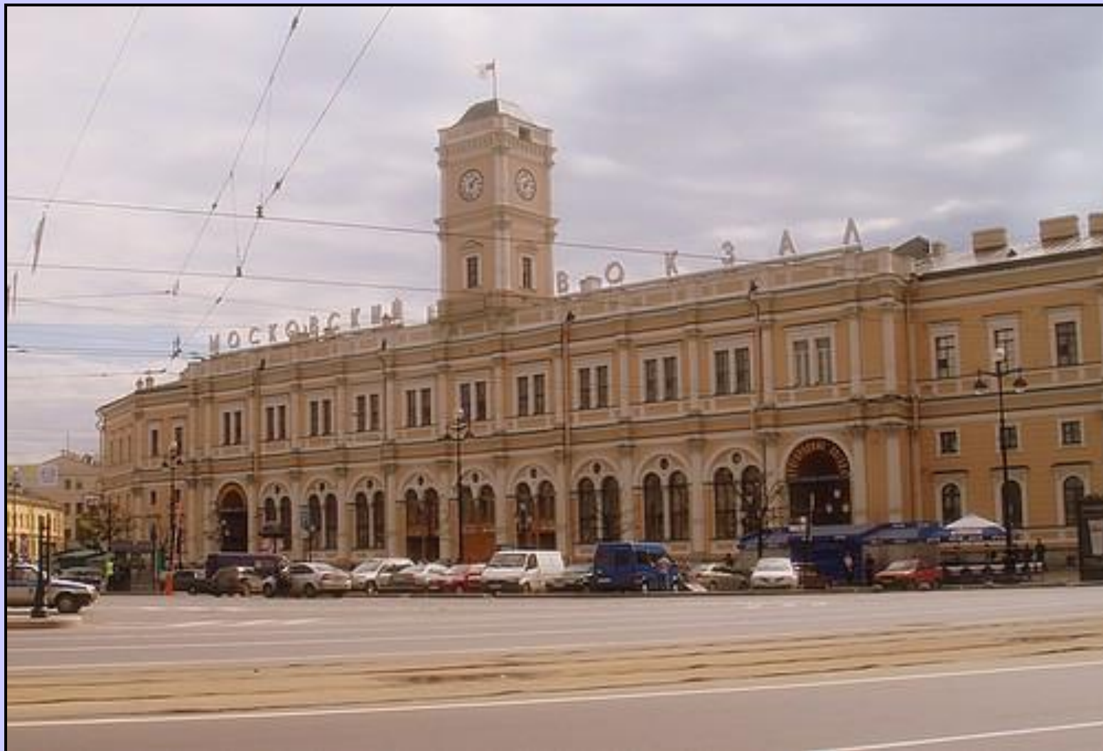
Московский Железнодорожный вокзал