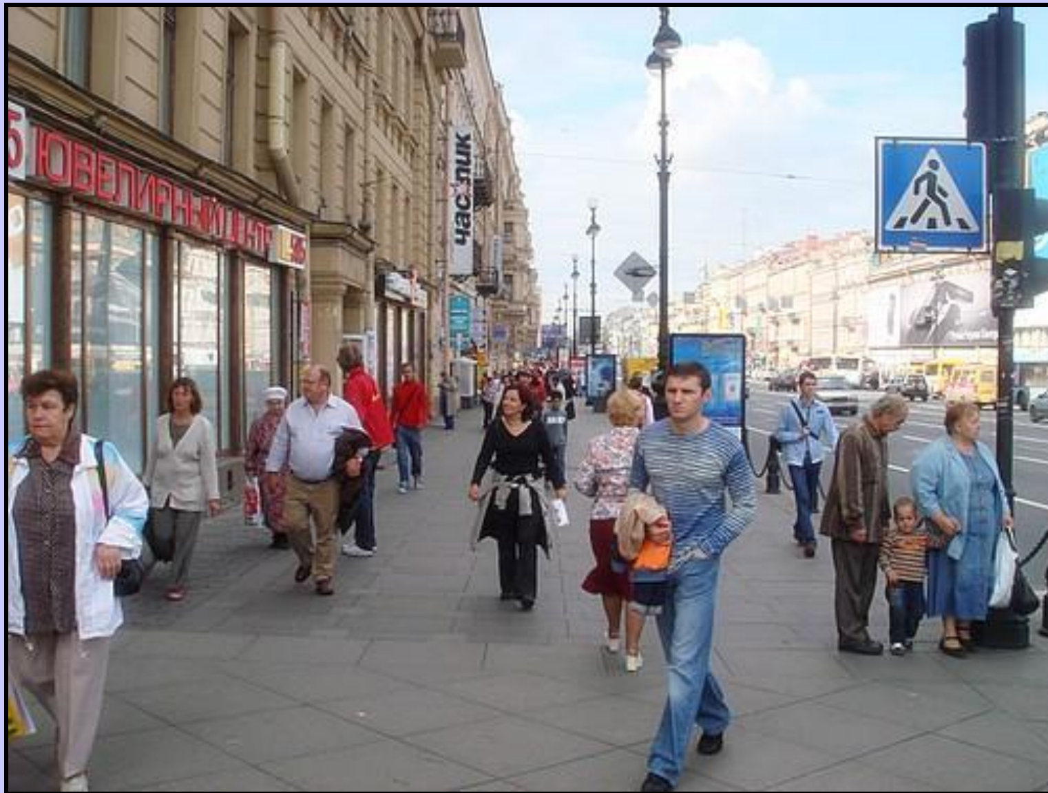
Центральная улица – Невский проспект