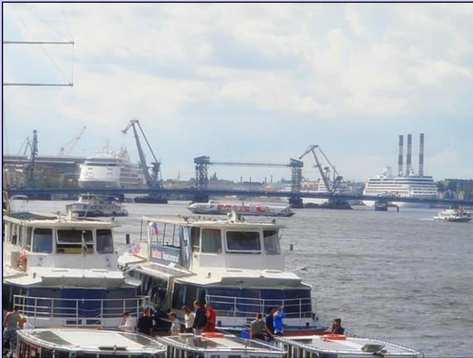
Порт на Неве реке