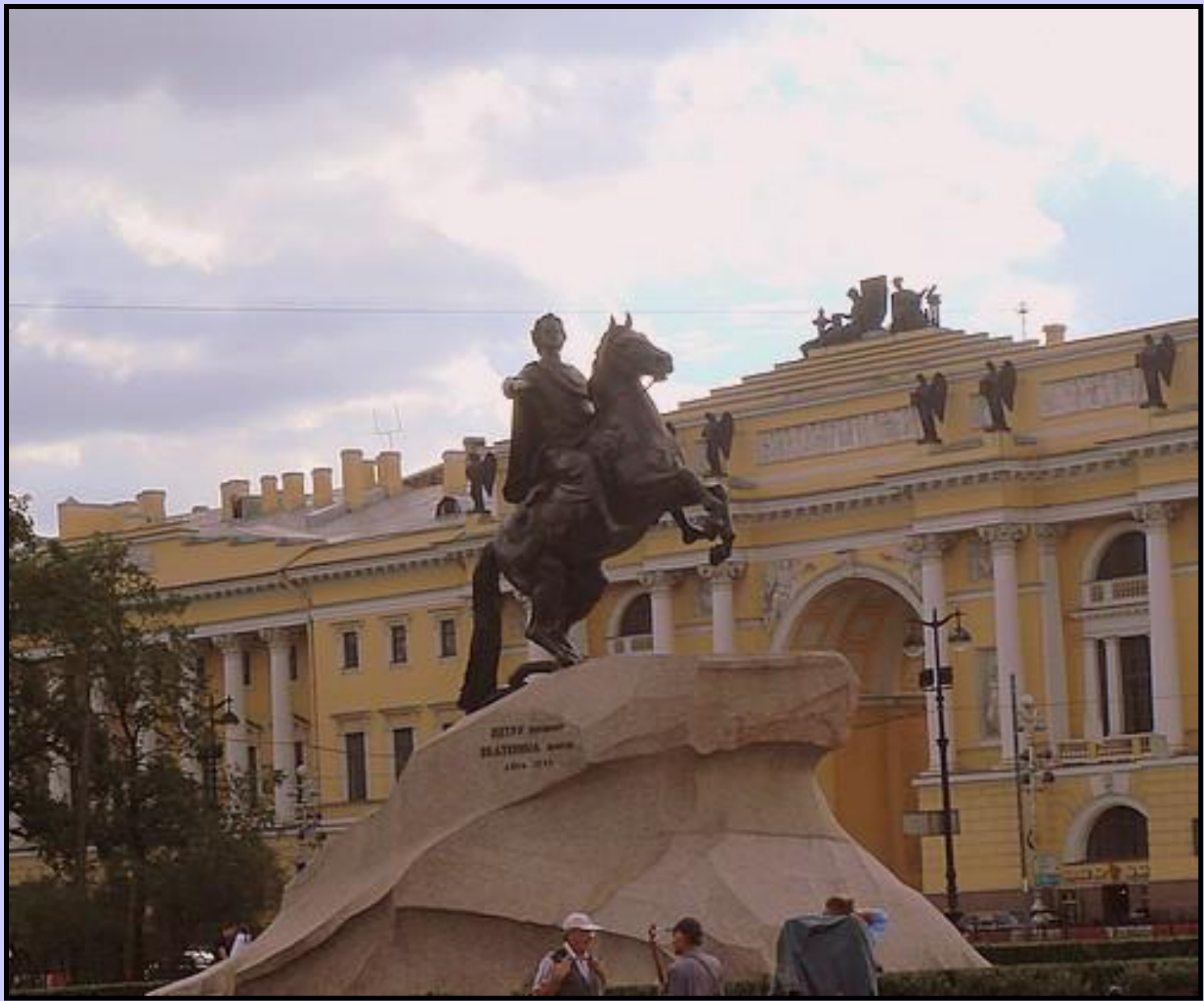
Памятник Петру ■