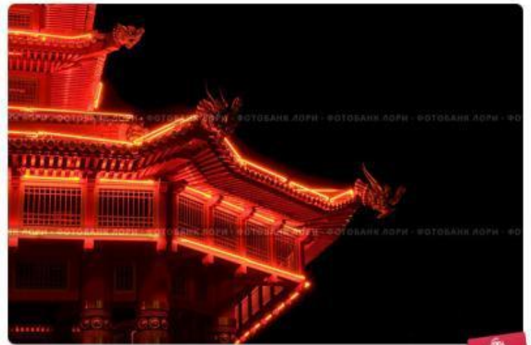
Элиста, Калмыкия. Фрагмент "Пагоды Семи Дней" с ночной подсветкой