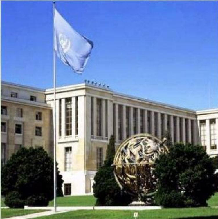
Отделение ООН в Женеве (Швейцария).