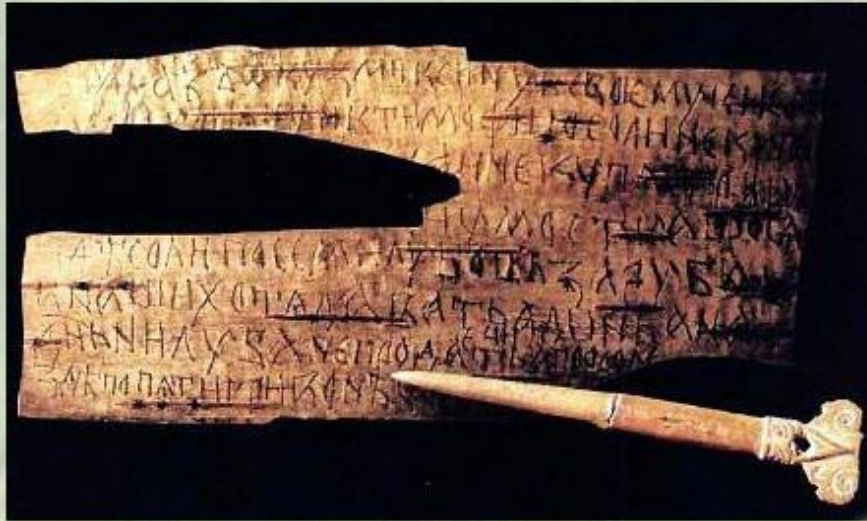
Древнерусская берестяная грамота.