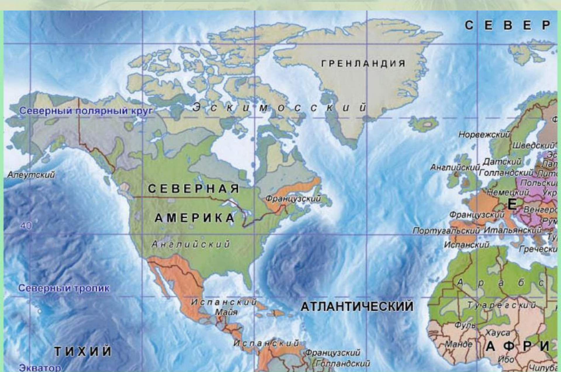
Языки народов мира.