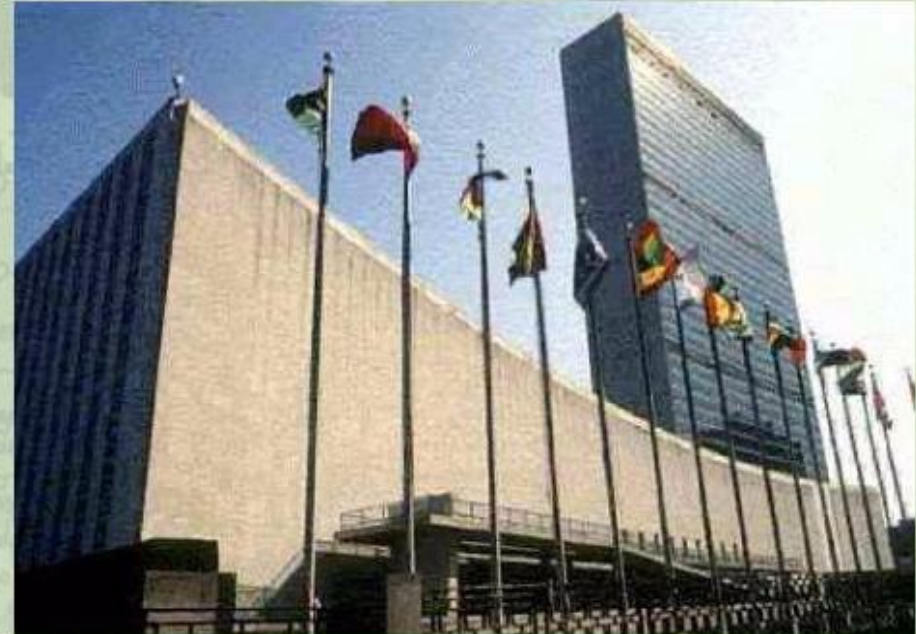
Штаб-квартира ООН в Нью-Йорке (США).

Официальными языками Организации Объединенных Наций являются английский, французский, испанский, русский, китайский и арабский языки.