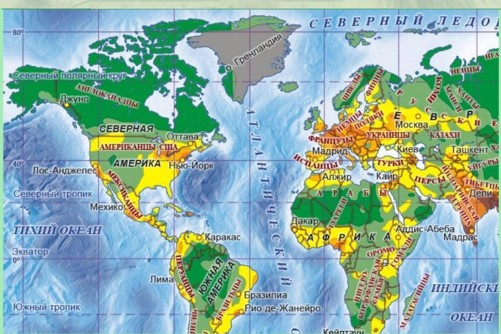
Карта народов мира.