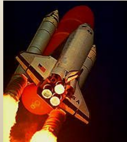
Космический корабль «Шатлл»