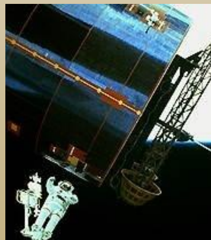
Космический аппарат «Синком IV-3»