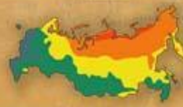
СТЕПЕНЬ БЛАГОПРИ- ЯТНОСТИ ПРИРОДНЫХ УСЛОВИЙ ЖИЗНИ НАСЕЛЕНИЯ