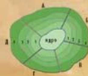
РАЙОНИРОВАНИЕ "СНИЗУ" (УЗЛОВОЕ)