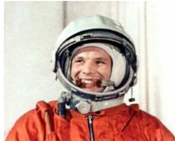
Гагарин Юрий Алексеевич