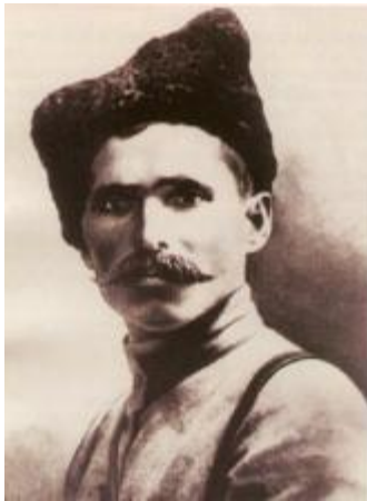
Чапаев Василий Иванович