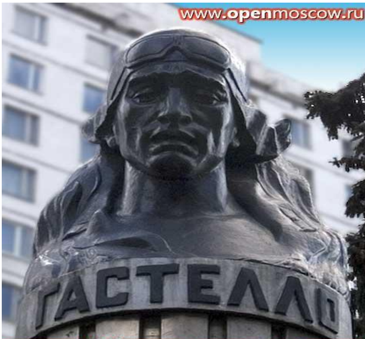
Памятник Н.Ф.Гастелло | Скульптор Б.А.Мочков Гастелло ул, 2/22, метро "Сокольники"