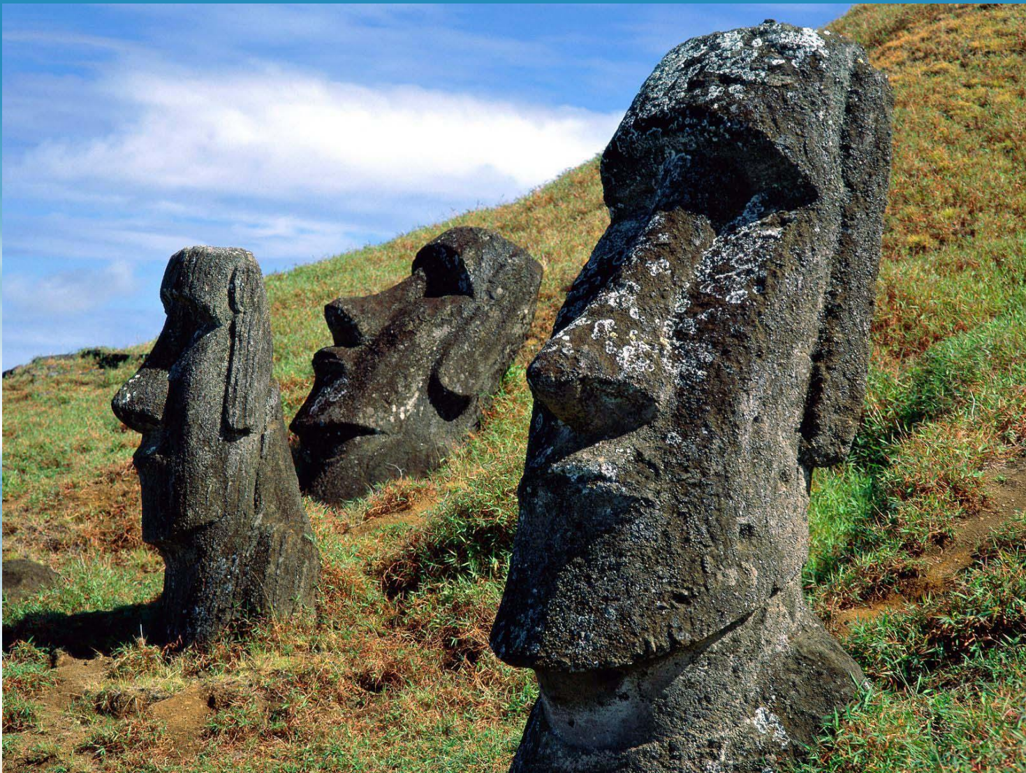
Статуи моаи на острове Пасхи